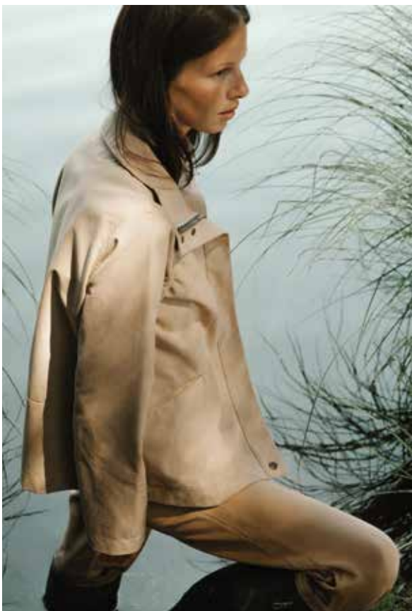
Jacket: Theodora-ODC | Shirt: Ewa-NP | Pants: Isa-ILC