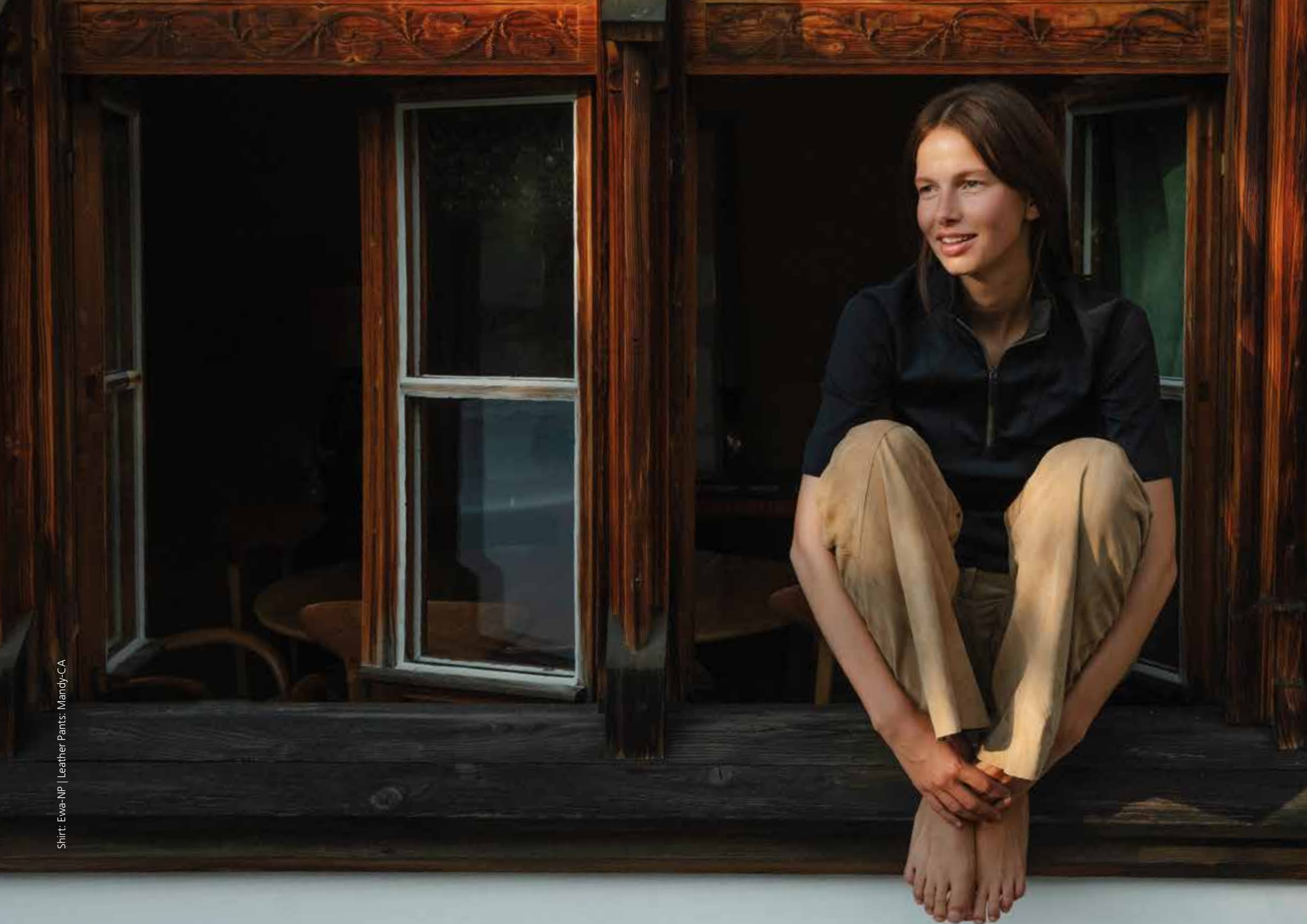
Shirt: Ewa-NP | Leather Pants: Mandy-CA