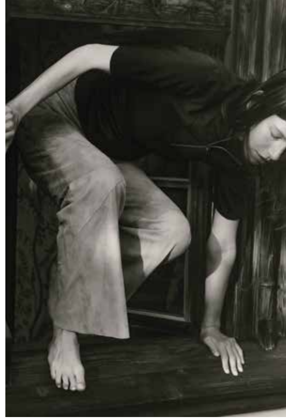
Women: Shirt: Ewa-NP | Leather Pants: Mandy-CA Men: Leather Jacket: Sascha-EL | Shirt: Emil-SJ | Leather Pants: Dean-EL