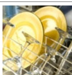
Lavagem automática de loiça