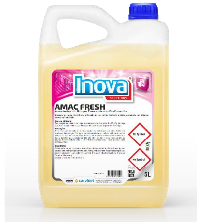
IMAGEM DE PRODUTO

Lavagem manual: Recomenda-se o uso de 15-30 gramas para 10 litros de água.