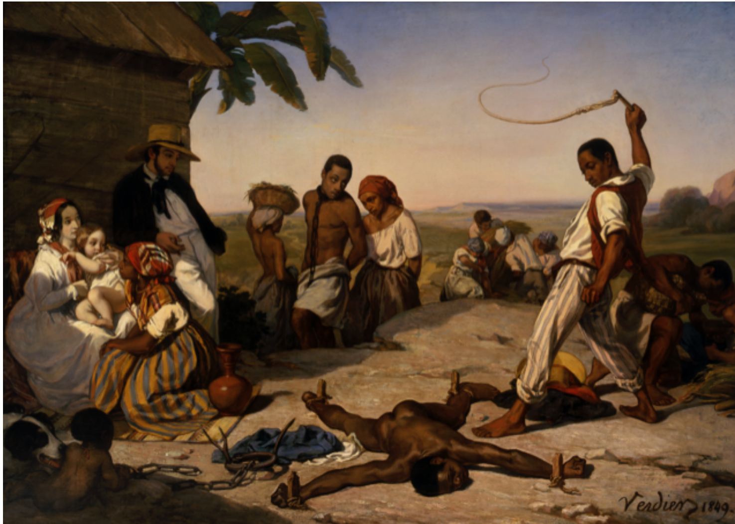
Marcel Antoine Verdier, Châtiment des quatre piquets dans les colonies , 1843