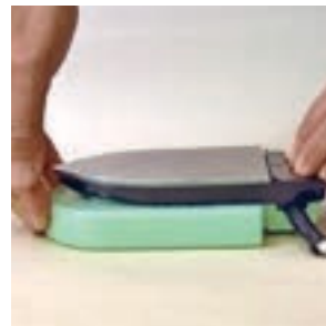
Raudan voi muuntaa pieneksi lämpölevyksi