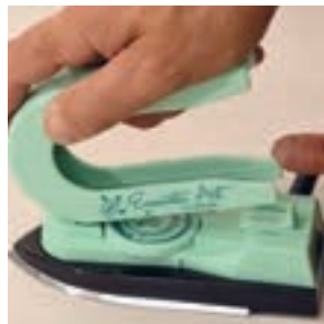
Kiinnitä kahva kiinni rautaan

Maalausraudan kahvan voi irrottaa jolloin rautaa voi käyttää pienenä lämpölevynä. Aseta kahva Encaustic Art -logopuoli alaspäin työtasolle ja iu'uta rauta sen päälle, kunnes se napsahtaa kevyesti kiinni.