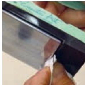
Puhdista raudan urat