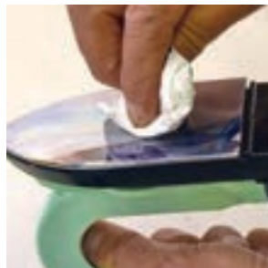
Puhdista rauta talouspaperilla