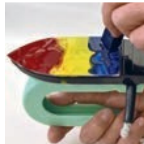
Sulata raudalle vaha