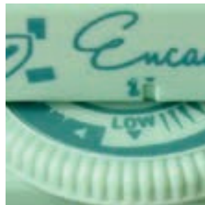
Aseta lämpötilanvalitsin kohtaan LOW