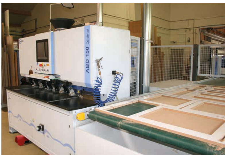
◀ Die Weeke ABD 150 CNC Stationärmachine zum horizontalen Bohren und Dübeln befindet sich unmittelbar neben der Nesting-Maschine

higkeiten und das qualitative Fertigungsniveau über den Großraum München hinaus herumgesprochen hat, lässt sich an der Tatsache festmachen, dass sich der größte Teil der Kunden aus Weiterempfehlungen rekrutiert. „In unseren Ausstellungsräumen hier am Ort zeigen wir auf 500 m 2 diverse Musterküchen und Einbauten. Das trägt sicher auch zu einem großen Teil bei, Kunden zu gewinnen“, meint er und ergänzt: „Die Richtung, die wir hauptsächlich fertigen, ist