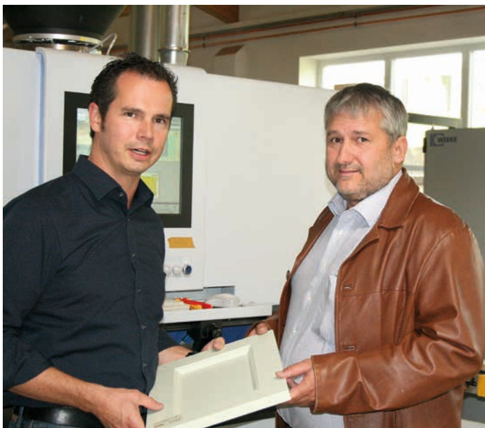
◀ (v.li.n.re.) Nesting-Maschine Vantage 200 aus dem Weeke-Baukastensystem