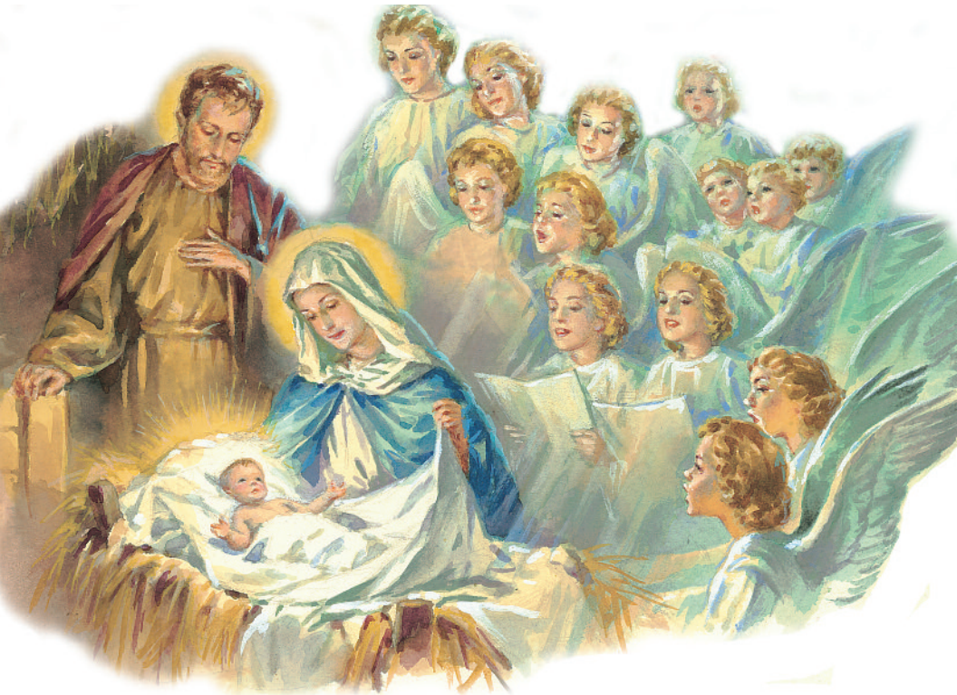
Jesús nació en un Establo