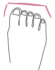
スクエア 長さあまり差がない