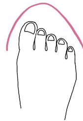
エジプト 親指が一番長い