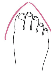
ギリシャ 人差し指が一番長い