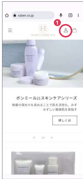
(1) ルーベン化粧品トップページ <www.ruben.co.jp>の右上の人マークをタップ