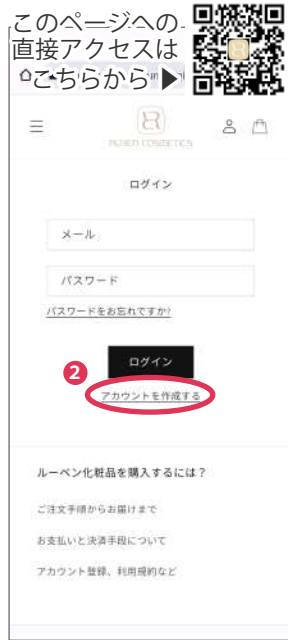
(2) 「アカウントを作成する」をタップ (3) 必要事項をすべて入力、確認後、「作成する」をタップ