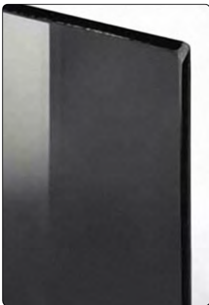
Cod. vetro fumé