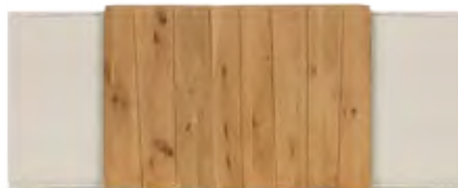
Art.8051 pag. 14