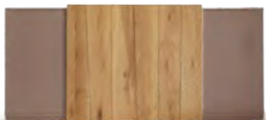
Art.8050 pag. 14