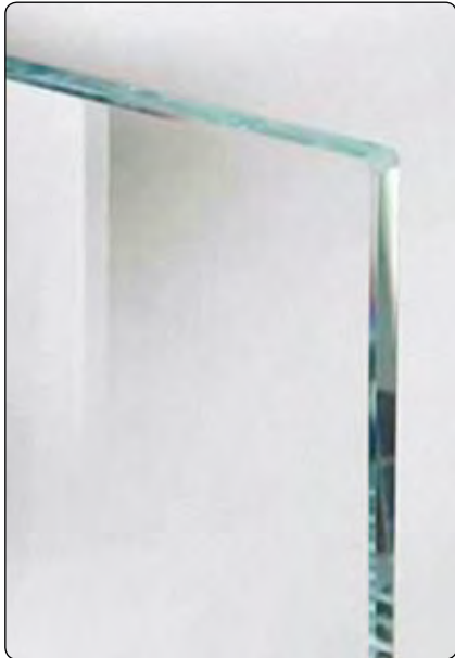
Cod. vetro extrachiaro