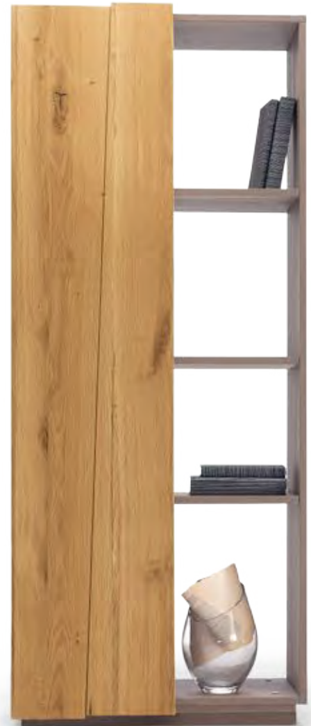
Art.8054 154 x 43 x H 181 / FIN. 101-100