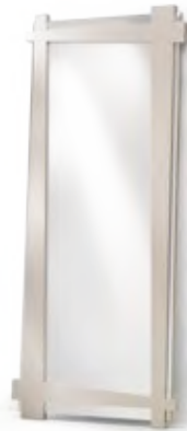
Art.8062 pag. 52