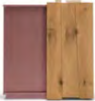
Art.8053 pag. 30