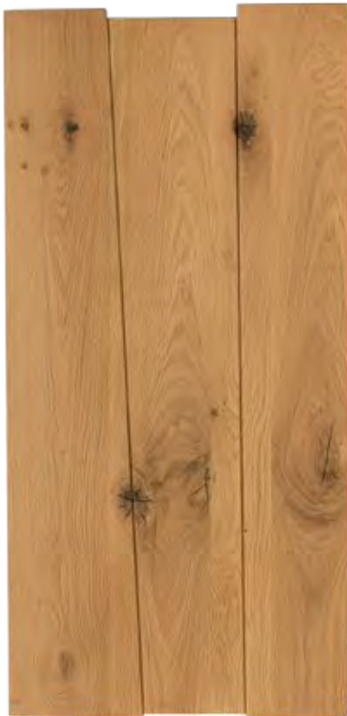
Cod.100 nodato naturale