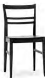
Art.7073 pag. 56