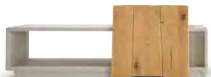
Art.8058 pag. 46