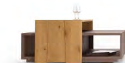
Art.8059 pag. 49