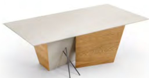
Art.8065 pag. 20