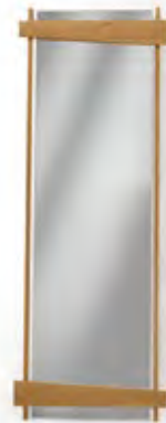
Art.8063 pag. 54