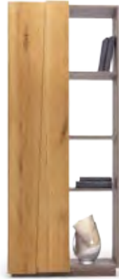
Art.8055 pag. 17