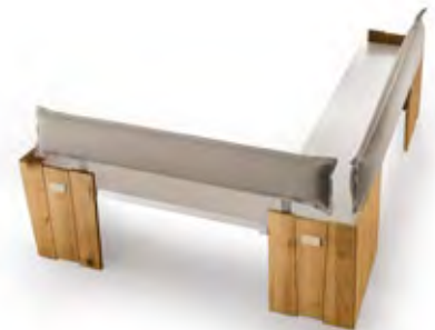
Art.8070 pag. 28