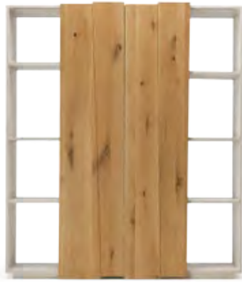
Art.8054 pag. 16