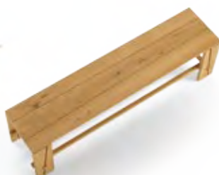
Art.8066 pag. 38