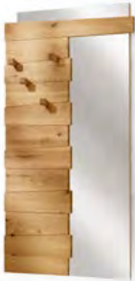
Art.8061 pag. 50