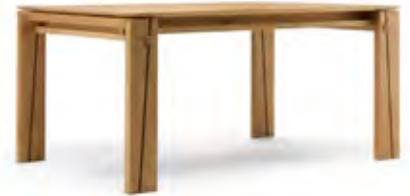
Art.8064 pag. 32