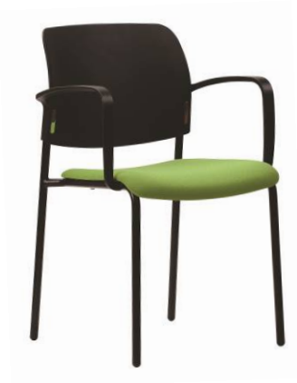
RO 942 A.044