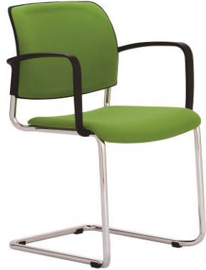
RO 953 A.044