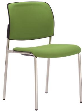
RO 953 A.044