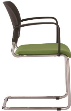
RO 952 A.044