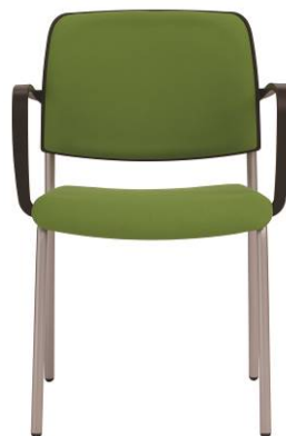
RO 943 A.044