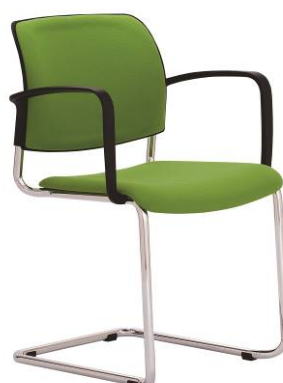
RO 953 A.044