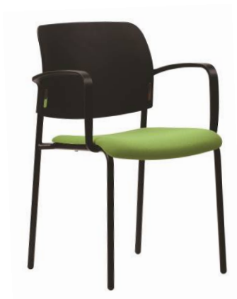
RO 942 A.044