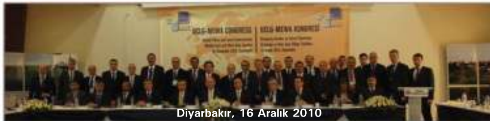
Diyarbakır, 16 Aralık 2010