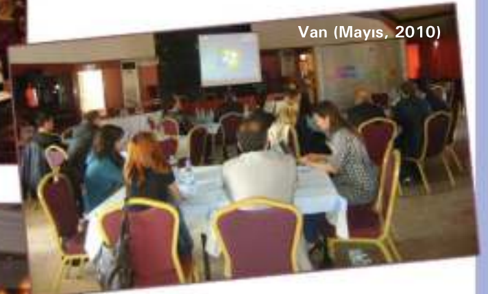
Van (Mayıs, 2010)