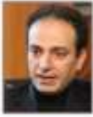
Osman Baydemir Diyarbakır Büyükşehir Belediye Başkanı, (Türkiye)