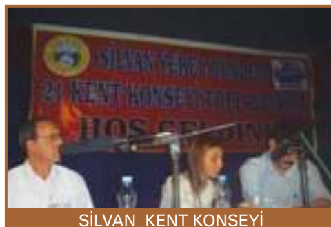
SİLVAN KENT KONSEYİ