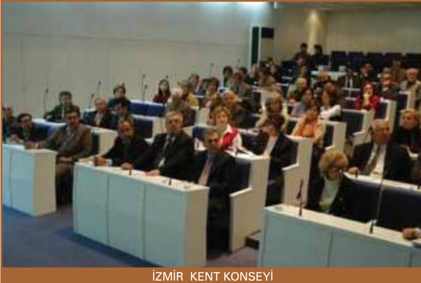
İZMİR KENT KONSEYİ