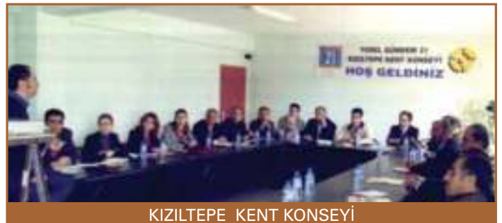
KIZILTEPE KENT KONSEYİ