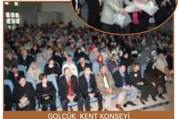
GÖLCÜK KENT KONSEYİ