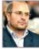
Mohammad Bager Qalibaf Tahran Belediye Başkanı, (İran)