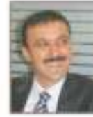
İsmail Bayram Düzce Belediye Başkanı (Türkiye)