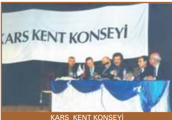
KARS KENT KONSEYİ