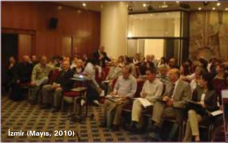
İzmir (Mayıs, 2010)