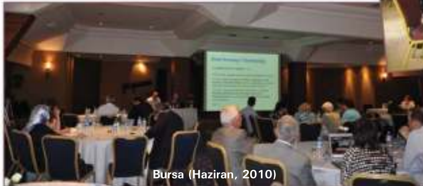
Bursa (Haziran, 2010)