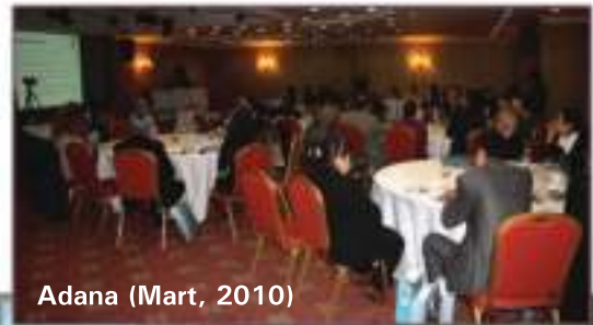
Adana (Mart, 2010)