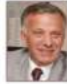
Yakup Koçal Yalova Belediye Başkanı (Türkiye)