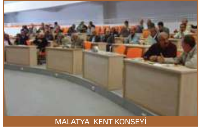
MALATYA KENT KONSEYİ