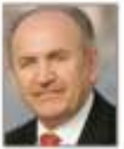
Kadir Topbaş UCLG Başkanı, İstanbul Büyükşehir Belediye Başkanı (Türkiye)

UCLG yönetim organları, üç yılda bir yapılan UCLG Dünya Kongreleri ile eşzamanlı olarak seçilmektedir. Son olarak, 2010-2013 dönemi UCLG yönetim organları; 17-20 Kasım 2010 tarihlerinde Mexico City'de (Meksika) düzenlenen Üçüncü UCLG Dünya Kongresi bağlamında seçilmiştir. Bu Kongre'de İstanbul Büyükşehir Belediye Başkanı Dr. Kadir TOPBAŞ, 2010-2013 dönemi için UCLG Dünya Başkanı seçilmiştir.