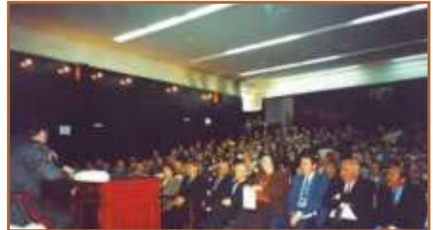
NEVŞEHİR KENT KONSEYİ