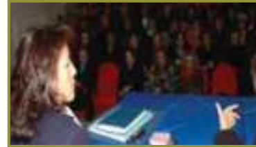
KUŞADASI KENT KONSEYİ