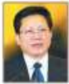
Wan Qingliang Eş-Başkan Guangzhou Belediye Başkanı (Çin/Asya-Pasifik)