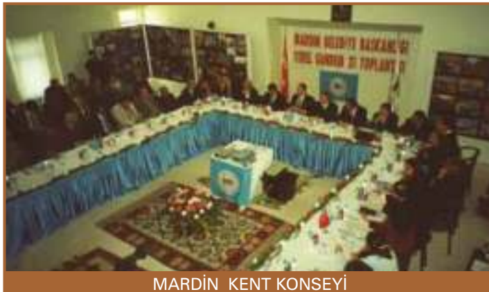
MARDİN KENT KONSEYİ