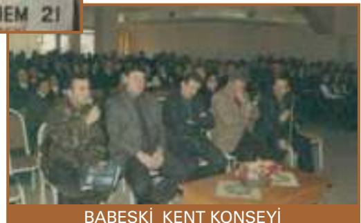
BABAESKİ KENT KONSEYİ