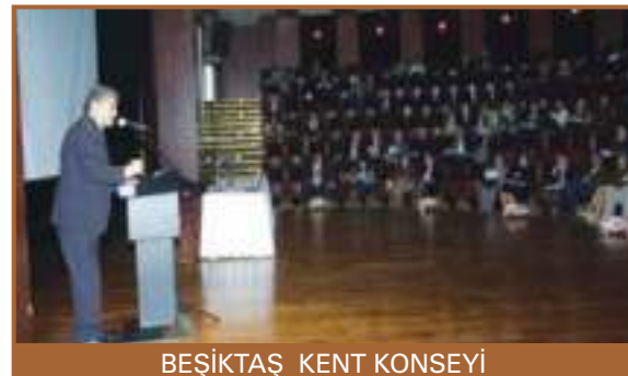
BEŞİKTAŞ KENT KONSEYİ