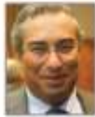
Antonio Costa Eş-Başkan Lizbon Belediye Başkanı (Portekiz/Avrupa)