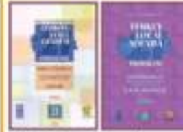
YG-21 Uygulamalarına Yönelik Kolaylaştırıcı Bilgiler Elkitabı

YG-21 Programı'nın ilk yayınları arasında yer alan "Yerel Gündem 21 Planlama Rehberi", 1999 yılında basılmıştır. ICLEI - Uluslararası Yerel Çevre Girişimleri Konseyi tarafından 1996 yılında basılan rehberin Türkçe çevirisi olan bu yayın, İngilizce baskısı ile benzer bir formatta olacak şekilde hazırlanmıştır. Rehber, sürdürülebilir kalkınma sorunlarının ele alınabilmesi için yerel eylem planları geliştirme sürecini ele almaktadır. Rehber'de sunulan planlama çerçevesi, dünyanın pek çok yerinde uygulanan YG-21 planlama girişimleri göz önünde bulundurularak hazırlanmıştır. Rehber, yerel yönetimler ve sivil toplum kuruluşları için çok yararlı bir başlangıç ve teknik bilgi kaynağı işlevi görmeyi sürdürmektedir.