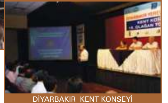
DIYARBAKIR KENT KONSEYİ