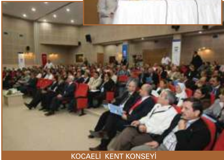
KOCAELİ KENT KONSEYİ