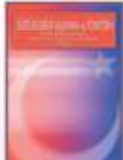
Sürdürülebilir Kalkınma ve Yönetişim

YG-21 Programı'nın ilk yayınları arasında yer alan "Yerel Gündem 21 Planlama Rehberi", 1999 yılında basılmıştır. ICLEI - Uluslararası Yerel Çevre Girişimleri Konseyi tarafından 1996 yılında basılan rehberin Türkçe çevirisi olan bu yayın, İngilizce baskısı ile benzer bir formatta olacak şekilde hazırlanmıştır. Rehber, sürdürülebilir kalkınma sorunlarının ele alınabilmesi için yerel eylem planları geliştirme sürecini ele almaktadır. Rehber'de sunulan planlama çerçevesi, dünyanın pek çok yerinde uygulanan YG-21 planlama girişimleri göz önünde bulundurularak hazırlanmıştır. Rehber, yerel yönetimler ve sivil toplum kuruluşları için çok yararlı bir başlangıç ve teknik bilgi kaynağı işlevi görmeyi sürdürmektedir.