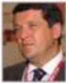
Ilсур Metshin Eş-Başkan Kazan Belediye Başkanı (Rusya/Avrasya)