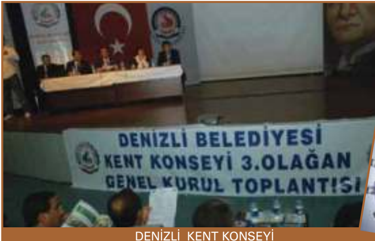
DENİZLİ KENT KONSEYİ