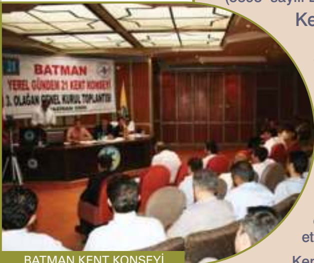
BATMAN KENT KONSEYİ

Kent konseyinin çalışma usûl ve esasları İçişleri Bakanlığınca hazırlanacak yönetmelikle belirlenir.