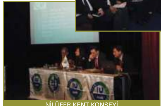
NİLÜFER KENT KONSEYİ