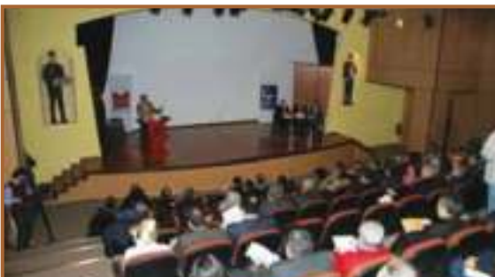
ZEYTİNBURNU KENT KONSEYİ