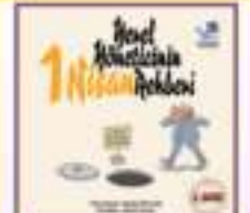
Yerel Yöneticinin 1 Nisan Rehberi

YG-21 süreçlerinin başlatılmasını ve yürütülmesini kolaylaştırmak amacıyla, Türkiye YG-21 Programı'nda edinilen deneyimlerin ışığında, "YG-21 Uygulamalarına Yönelik Kolaylaştırıcı Bilgiler" başlıklı bir Elkitabı hazırlanmıştır. Türkçe ve İngilizce olarak basılan Elkitabı'nda, ilk olarak, BM küresel zirveleri ve bunların gündemleri konusunda genel bilgiler verilmektedir. Sonraki bölümde Türkiye YG-21 Programı'na ilişkin bilgiler verilmekte, temel süreçlerin geliştirilmesi üzerinde durulmaktadır. Son bölümde, katılımcı platformların, koordinasyon ve destek birimlerinin ve yerel eylem planlama süreçlerinin kurulması ve işleyişine ilişkin "Sıkça Sorulan Sorular" a yanıtlanmaktadır. Elkitabı, Mart 2005'te (güncellenerek) yeniden basılmıştır.