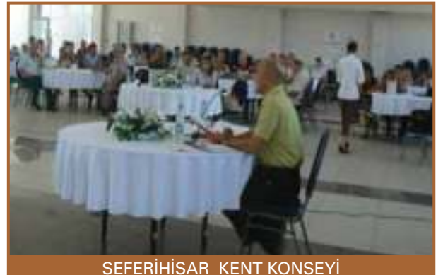
SEFERİHİSAR KENT KONSEYİ