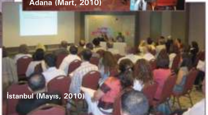
İstanbul (Mayıs, 2010)