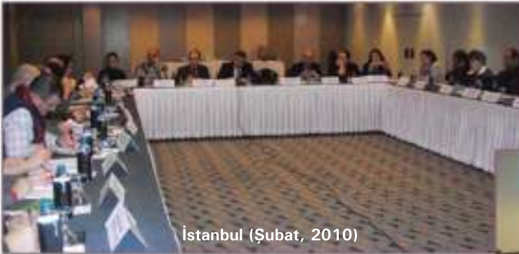
İstanbul (Şubat, 2010)

Bu çalışmaların ve bunların tamamlayıcı niteliğindeki diğer etkinliklerin değerlendirilmesi amacıyla yapılan Ulusal Yönlendirme