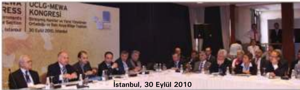
İstanbul, 30 Eylül 2010