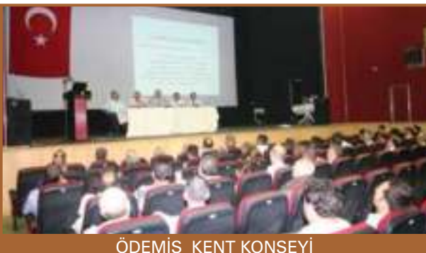
ÖDEMİŞ KENT KONSEYİ