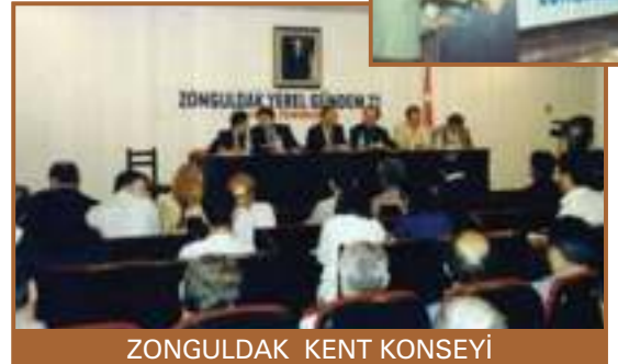
ZONGULDAK KENT KONSEYİ