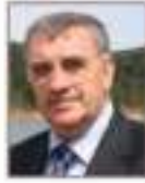
Zeki Toçoğlu Sakarya Büyükşehir Belediye Başkanı, (Türkiye)