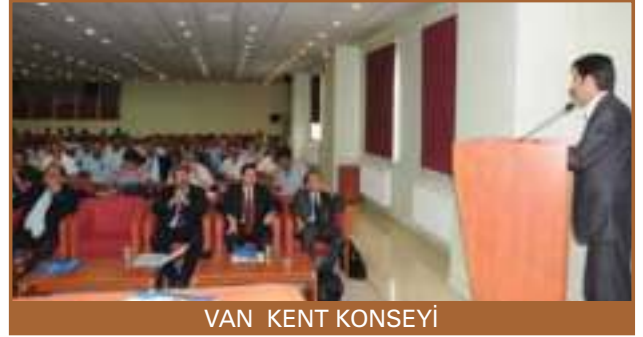
VAN KENT KONSEYİ