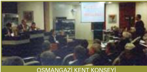
OSMANGAZI KENT KONSEYİ