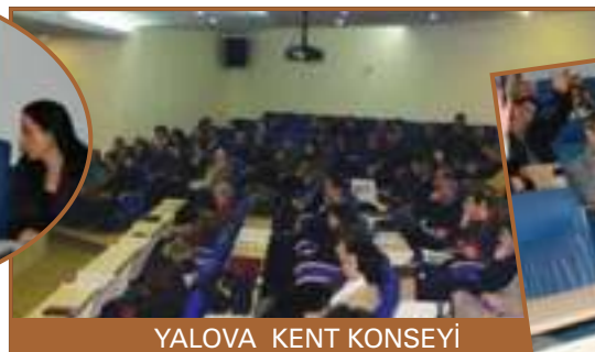
YALOVA KENT KONSEYİ