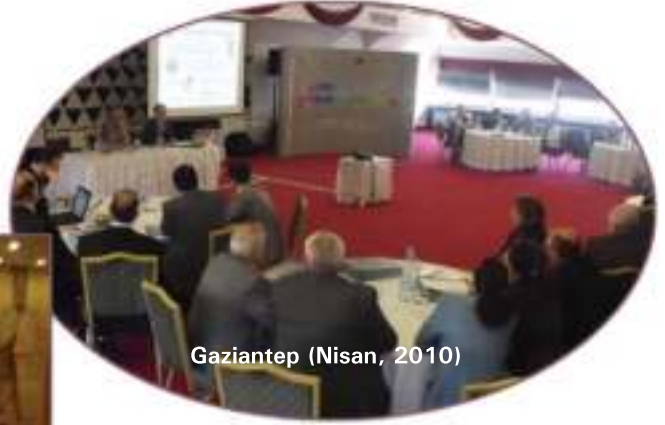
Gaziantep (Nisan, 2010)

Bu genel çerçevede, YG-21 Programı'nın sona ermesinden sonraki dönemde UCLG-MEWA'nın, başta İçişleri Bakanlığı Mahalli İdareler Genel Müdürlüğü ve Türkiye Belediyeler Birliği olmak üzere, ilgili kamu kuruluşları ve yine başta Dünya Yerel Yönetim ve Demokrasi Akademisi ve Habitat için Gençlik Derneği olmak üzere, ilgili sivil toplum kuruluşları ile yakın işbirliği içerisinde sürdürmeyi öngördüğü desteğin kapsamı, sonraki bölümde özetlenmektedir.