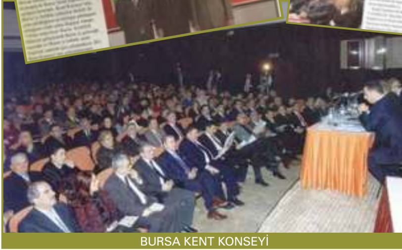
BURSA KENT KONSEYİ