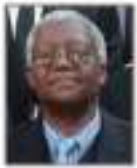
Muchadeyi Masunda Eş-Başkan Harare Belediye Başkanı (Zimbabve/Afrika)