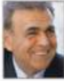
Aziz Kocaoğlu İzmir Büyükşehir Belediye Başkanı, (Türkiye)