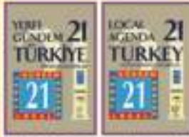
YG-21 Türkiye: Örnek Uygulamalar

2002 yılında düzenlenen BM Johannesburg Zirvesi'ne sunulan Türkiye Ulusal Raporu'nun altı ana temasından biri olan "Sürdürülebilir Kalkınma ve Yönetişim" başlıklı rapor, UCLG-MEWA'nın (önceki adıyla, IULA-EMME'nin) koordinasyonunda hazırlanmıştır. Türkiye'deki yönetim uygulamalarının son on yıllık döneminin değerlendirdiği Rapor'da, katılım, şeffaflık, hesap sorma, yerindenlik, uyumluluk ve etkinlik gibi "iyi yönetim" in temel ölçütleri ele alınmaktadır. Rapor, Türkiye'de bu konuda katılımcı yöntemlerle hazırlanmış ilk metin olmasının yanısıra, içerik bakımından da zengin bir başvuru kaynağı oluşturmaktadır.