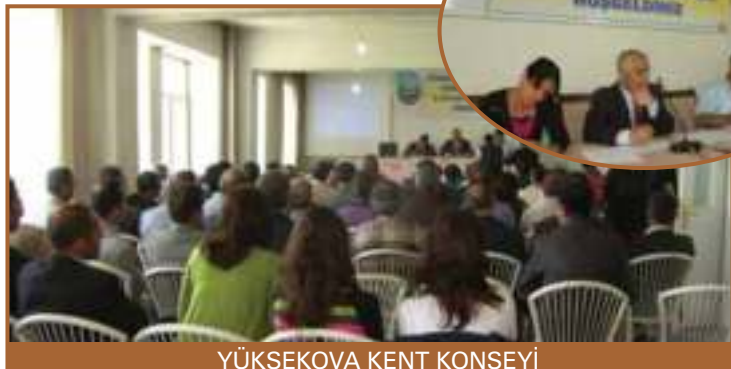
YÜKSEKOVA KENT KONSEYİ