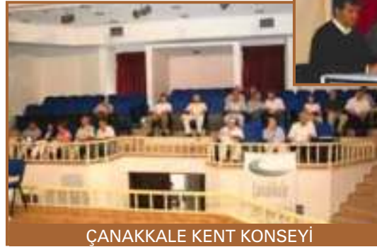
ÇANAKKALE KENT KONSEYİ