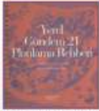
Yerel Gündem 21 Planlama Rehberi

UCLG-MEWA tarafından, YG-21 Programı'nın başlangıcından bu yana, her üç ayda bir Türkçe ve İngilizce olarak hazırlanan Gelişme Raporları, her yıl hazırlanan Mali Denetim Raporları, tamamlanan her proje için hazırlanan Sonuç Raporları, vb. raporlar ile tanıtım filmleri, bültenler, broşürler, elkitapları, rehberler, vb. yayınlar, çalışmaların izlenmesini ve değerlendirilmesini sağlamış ve Program'ın görsel-basılı hafızasını oluşturmuştur. Bu yayın ve belgelerin yanısıra, Program ortakları ve diğer ilgili kişi ve kuruluşlarca halen yararlanılmakta olan çeşitli kaynak yayınlar da hazırlanmış bulunmaktadır.