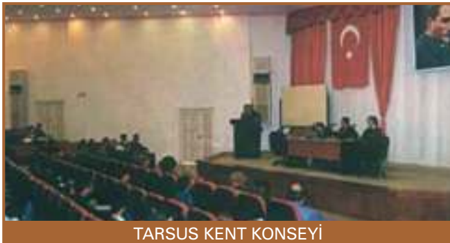
TARSUS KENT KONSEYİ