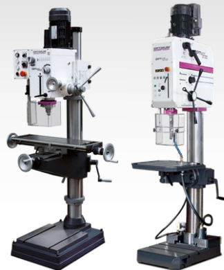
Perceuses à engrenages