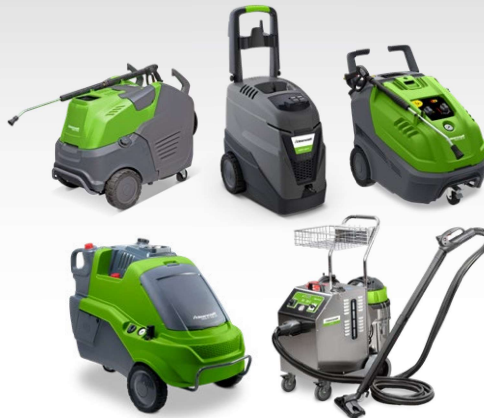
Nettoyeur à vapeur Nettoyeurs haute pression à eau chaude