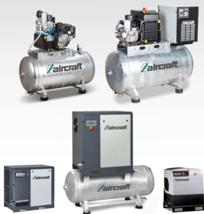
Compresseurs à vis Compresseur stationnaire à vis