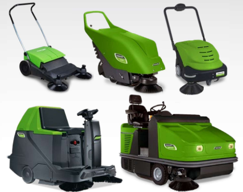
Balayeuses Balayeuse autoportée