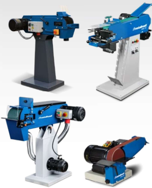
Ponceuses et Tanks