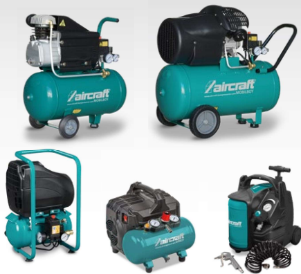
Compresseurs d'entrée gamme