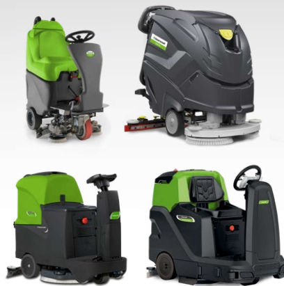
Machines de nettoyage autoportées