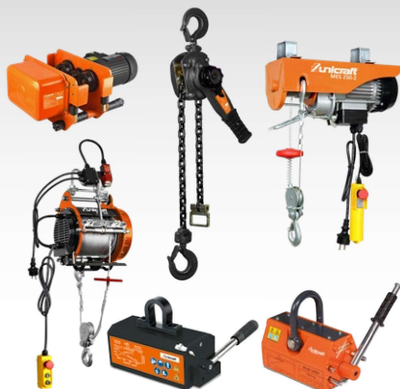
Aimants de levage de charge, palans à chaîne, treuil à câble, grue d'atelier