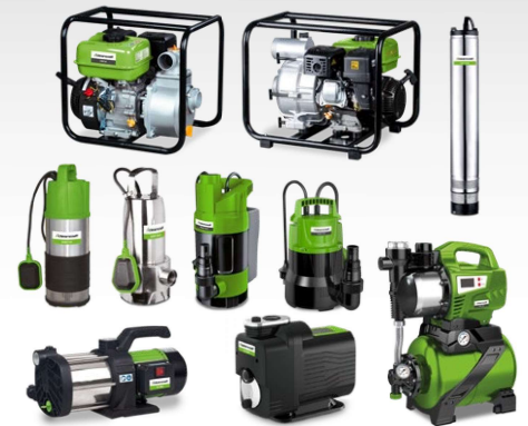
Pompes à eau claire Pompes à eau chargée