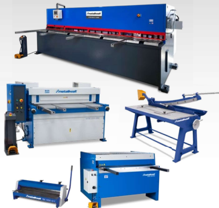
Cisailles Manuelles Cisailles motorisées