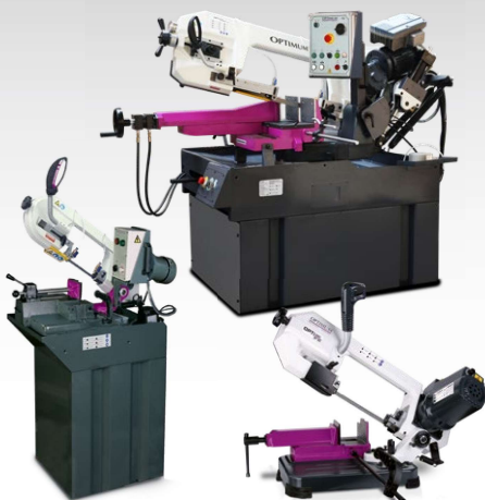
Scies à ruban