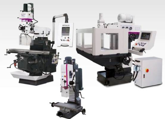
Perceuses/fraiseuses Fraiseuses d'outils Fraiseuses universelles