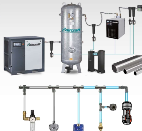
Systèmes de distribution de l'air comprimé