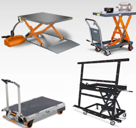
Tables élévatrices Transpalettes à ciseaux