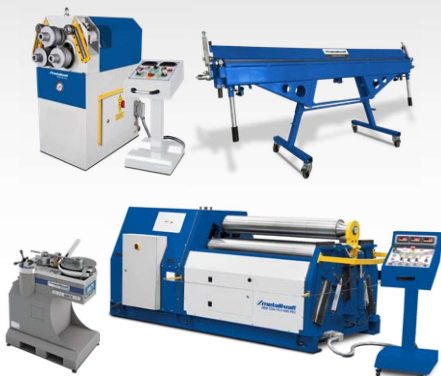
Rouleuses de tôles Cintreuses d'anneaux, de tubes et de ronds