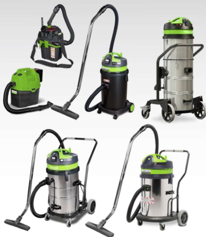
Aspirateurs à poussières