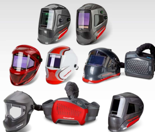
Casques de soudure