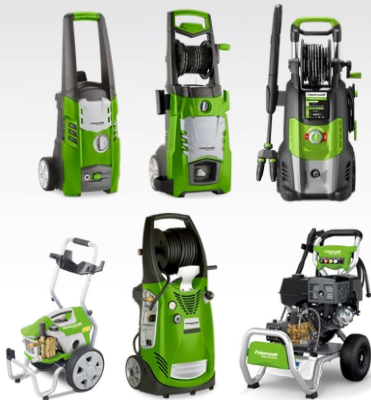
Nettoyeurs haute pression à eau froide