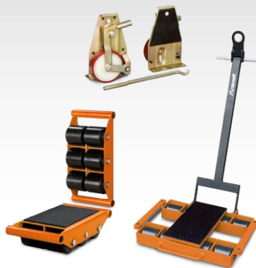
Rouleaux de transport Châssis de transport