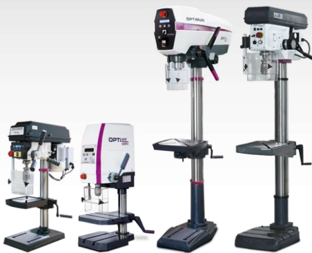
Perceuses d'établi Perceuses à colonne