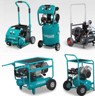
Compresseurs pour bricolage