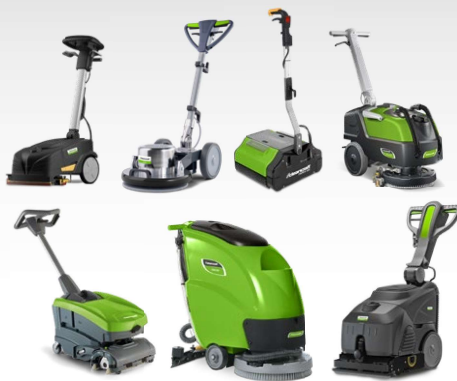
Machines de nettoyage