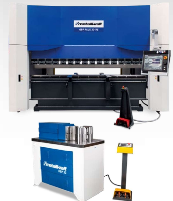
Plieuses manuelles Plieuses semi-motorisées Plieuses motorisées