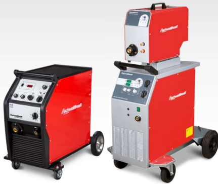
Poste à souder MIG/MAG en continu / à pas contrôlés