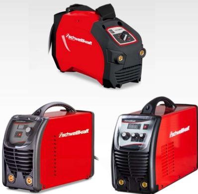
Postes à l'électrode enrobée