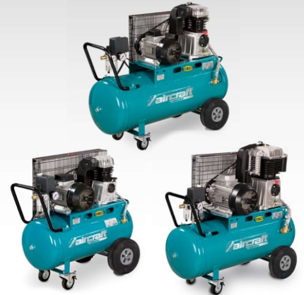
Compresseurs pour l'industrie