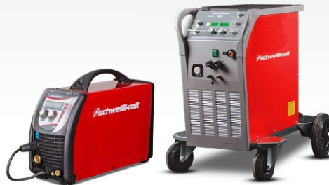
Poste à souder MIG/MAG impulsion