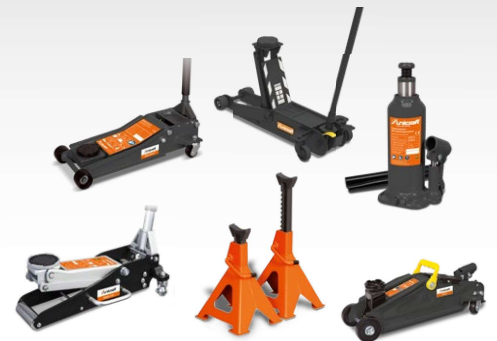
Crics et chandelles Lève-véhicules et ponts élévateurs