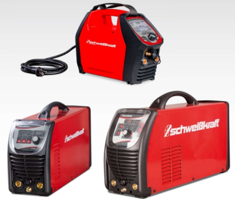
Poste à souder TIG