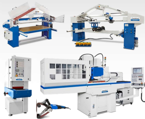
Rectifieuse Satineuses Ponceuses de tubes