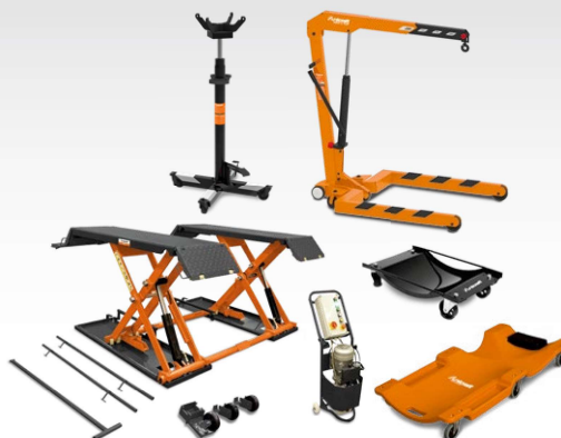
Élévateur de transmission, Grue d'atelier, plates-formes de levage, rampes d'accès