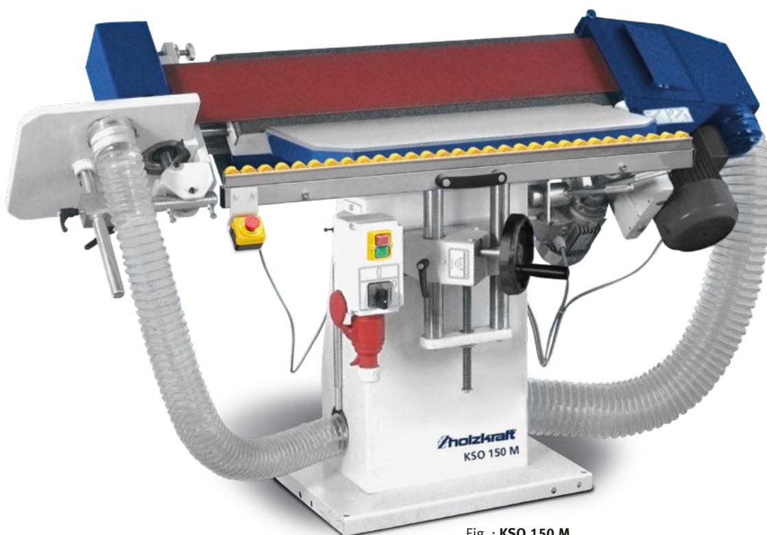
Fig. : KSO 150 M