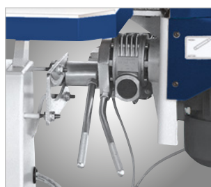
KSO 150 M