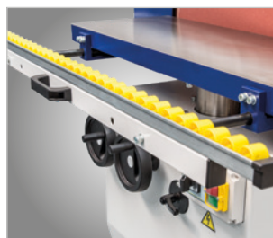
KSO 200 F