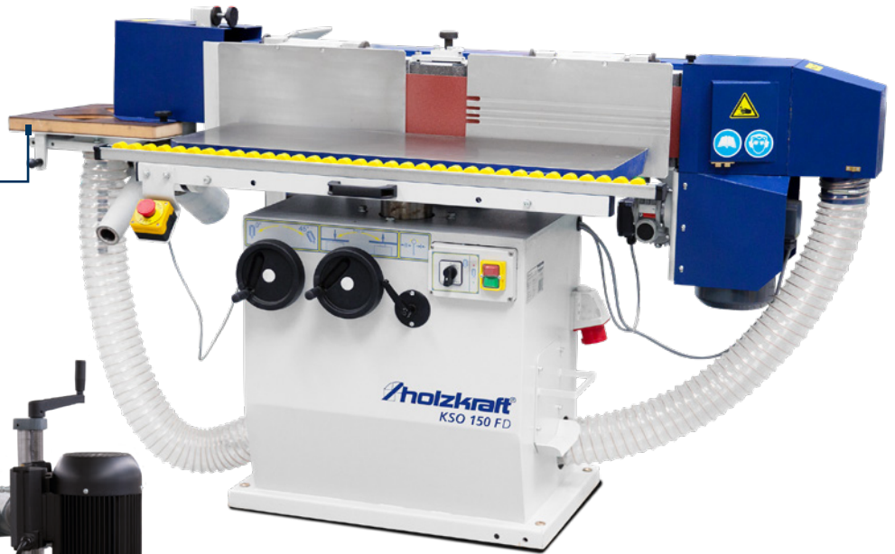
Fig. : KSO 150 FD