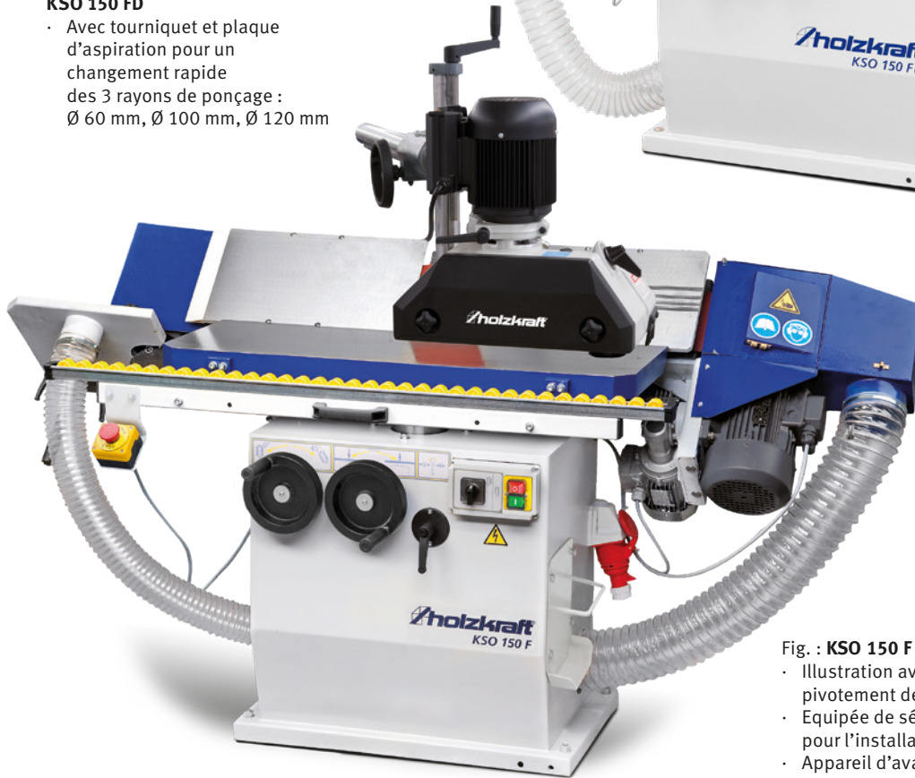
Fig. : KSO 150 F avec avance en option