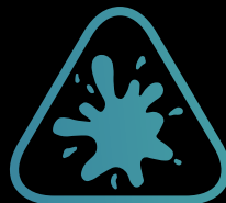
Beständig gegen Flecken