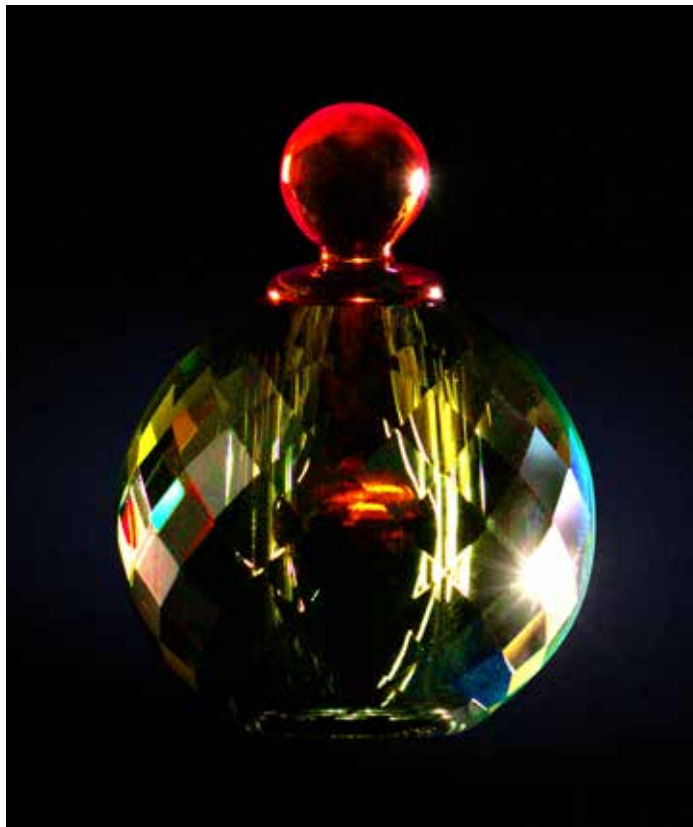
BOVEN 'ER LIGT ZOVEEL MEER GEVOEL IN VERVAT, EN SCHOONHEID', ZEGT ARICKX. 'DOOR DE TRANSPARANTIE IN HET ONTWERP IS ER ESTHETISCH VEEL MOGELIJK.'

En hoe staat hij tegenover fetisjisme? Arickx: 'Het woord 'fetisj' vind ik een heel mooi woord, zeker als je het over rituelen hebt.' Ziet hij typische fetisjobjecten als zweepjes ook als mogelijke Nightfall-objecten? Arickx: