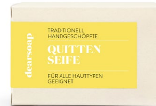
QUITTENSEIFE mit frischem Quittenduft Artikel-Nr. 4260392270122