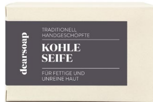
KOHLESEIFE mit Aktivkohle Artikel-Nr. 4260392270115