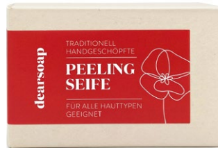
PEELINGSEIFE mit Mohnsamen Artikel-Nr. 4260392270313