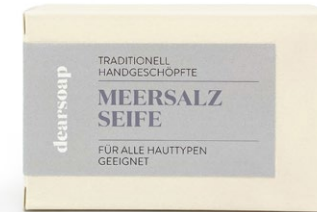
MEERSALZSEIFE mit 10 % Meersalz Artikel-Nr. 4260392270306