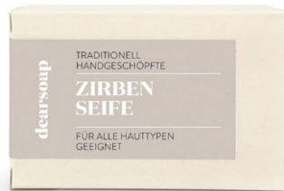
ZIRBENSEIFE mit Zirbenöl Artikel-Nr. 4260392270115