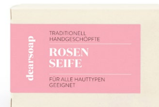
ROSENSEIFE mit feinem Rosenduft Artikel-Nr. 4260392270146