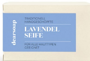
LAVENDELSEIFE mit Lavendelblüten Artikel-Nr. 4260392270153