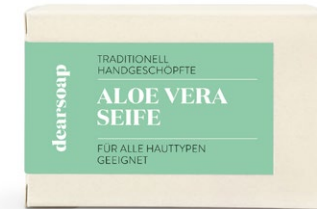
ALOE VERA SEIFE mit Aloe vera Artikel-Nr. 4260392270139