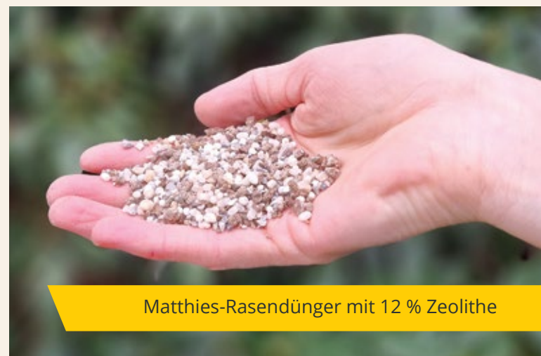
Matthies-Rasendünger mit 12 % Zeolithe