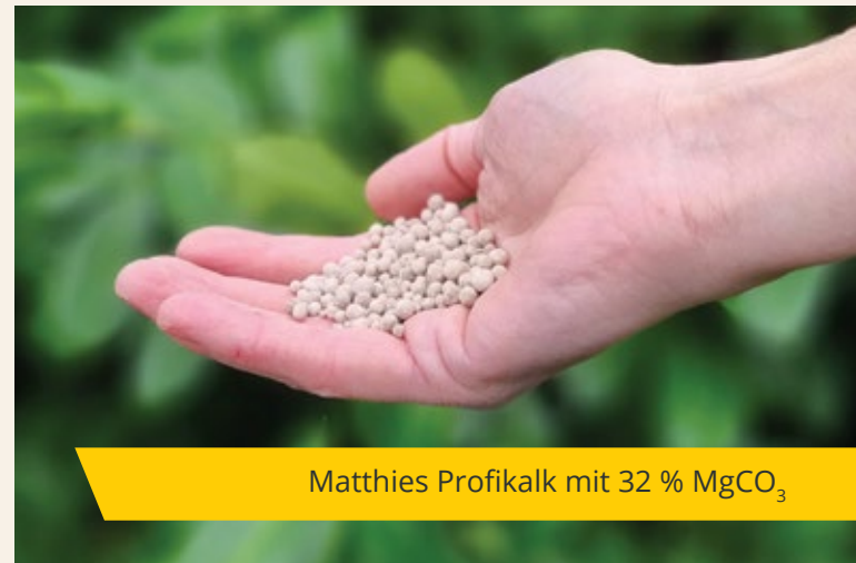
Matthies Profikalk mit 32 % \text{MgCO}_3

Unser Produkt vereint die positiven Aspekte und stellt damit eine optimale Mischung dar.