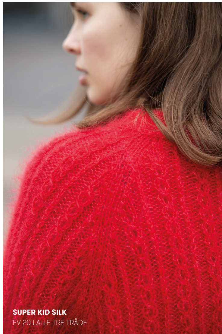
SUPER KID SILK FV 20 I ALLE TRE TRÅDE

Sy åbningen under ærmerne sm fra rts. Hæft alle ender godt.