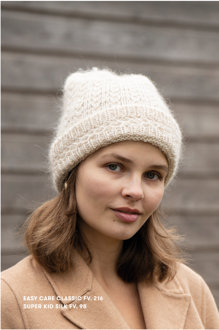
EASY CARE CLASSIC FV. 216 SUPER KID SILK FV. 98