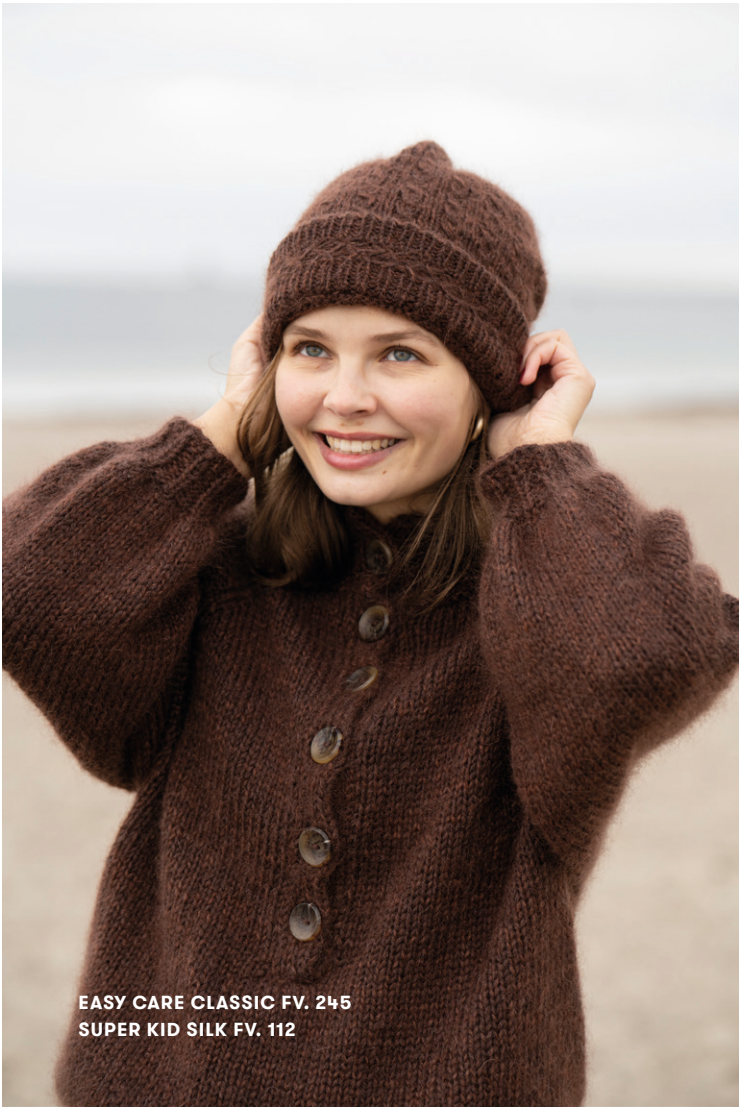
EASY CARE CLASSIC FV. 245 SUPER KID SILK FV. 112