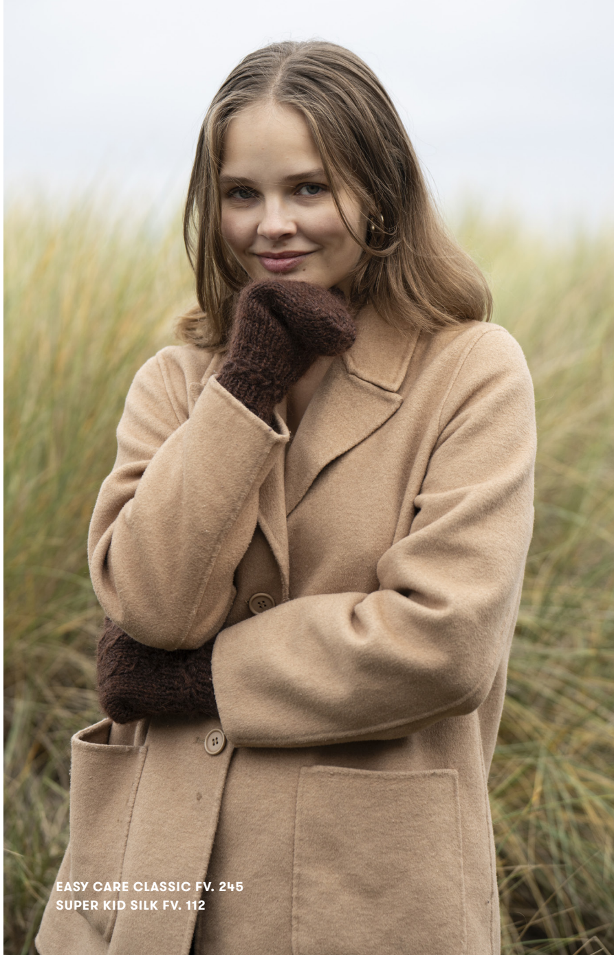
EASY CARE CLASSIC FV. 245 SUPER KID SILK FV. 112