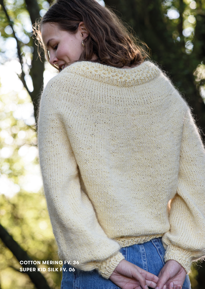
COTTON MERINO FV. 36 SUPER KID SILK FV. 06