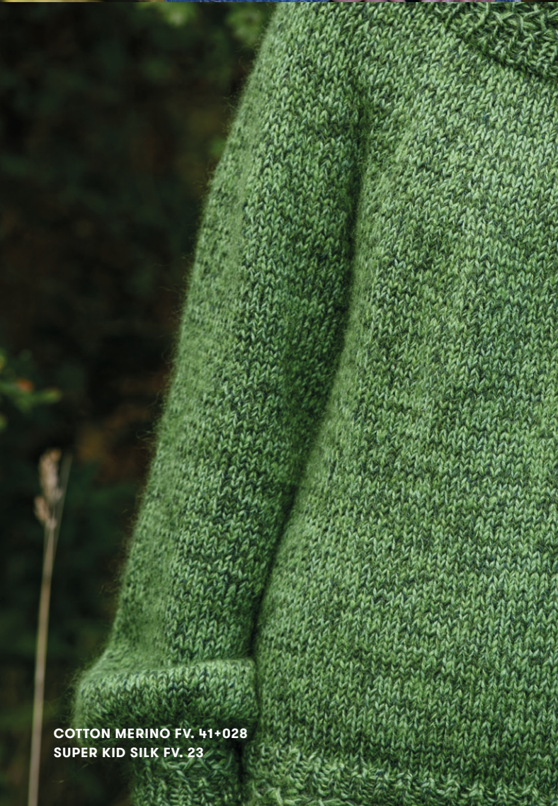
COTTON MERINO FV. 41+028 SUPER KID SILK FV. 23