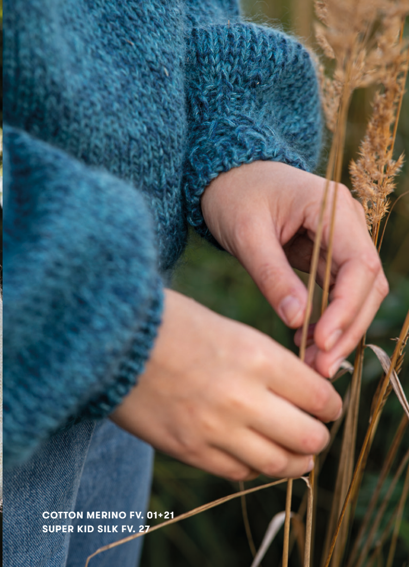
COTTON MERINO FV. 01+21 SUPER KID SILK FV. 27