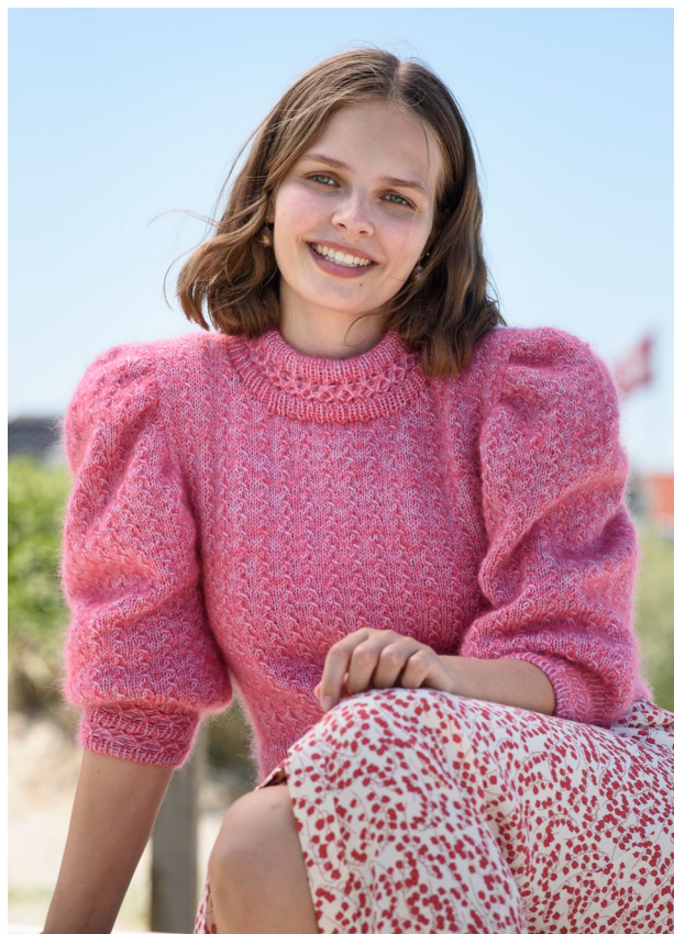
Variant: Mayflower Easy Care fv. 026 syren samt Mayflower Super Kid Silk fv. 13 orange rød