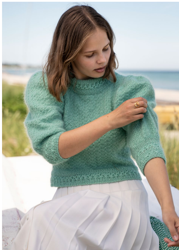
Variant: Mayflower Easy Care fv. 060 jadegrøn samt Mayflower Super Kid Silk fv. 11 lys aquamarine