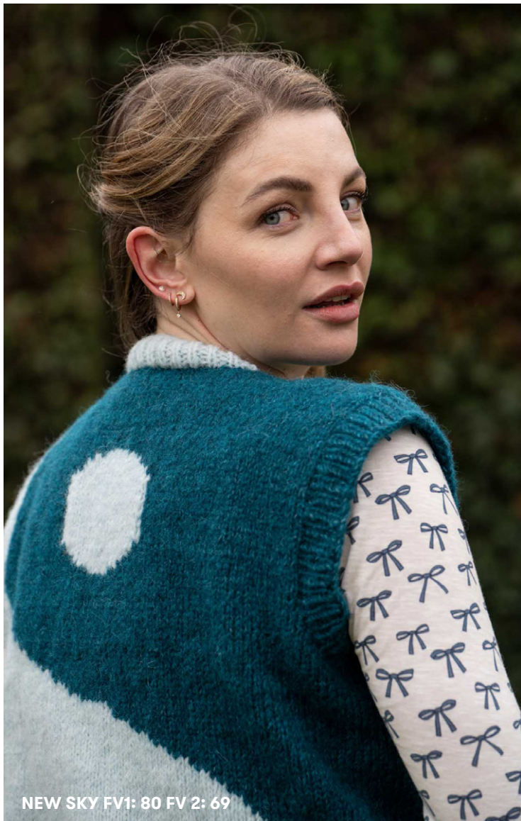
NEW SKY FV1: 80 FV 2: 69