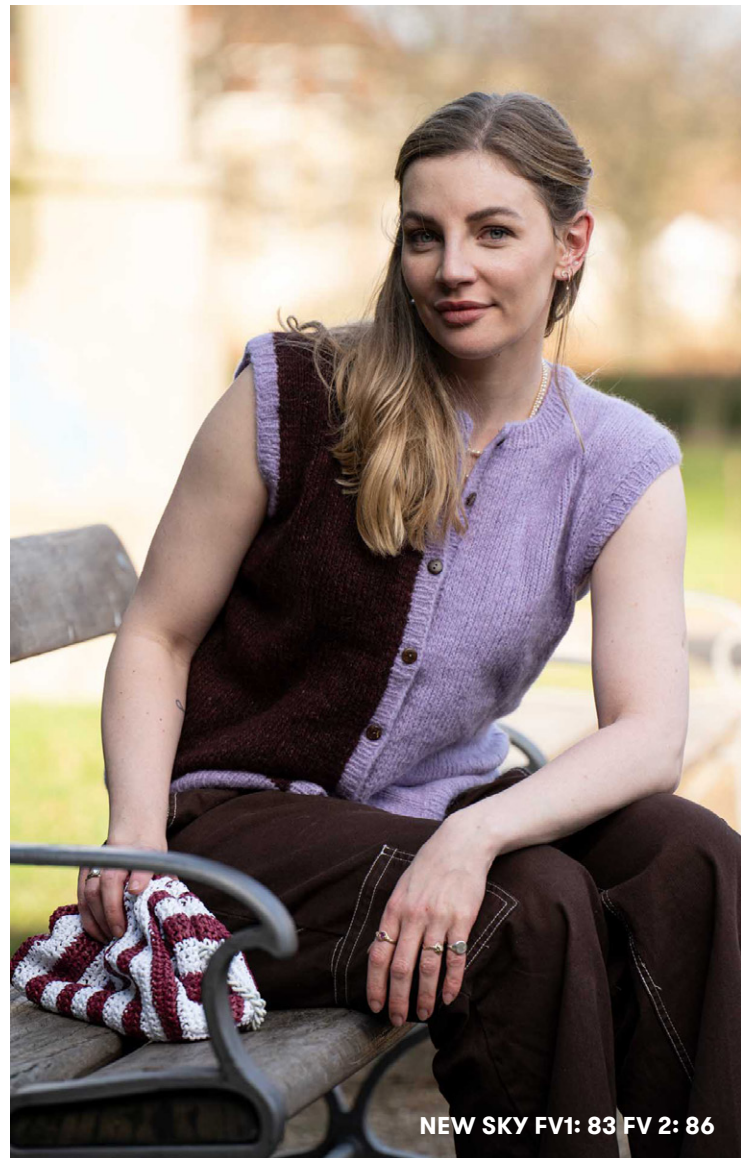
NEW SKY FV1: 83 FV 2: 86