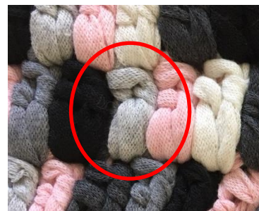
Et eksempel på et stangmaskepar

Der skal skiftes farve mellem hvert par af stangmasker. Der vælges en farve som ikke er i nærheden – der skiftes altså til en tilfældig farve hver gang. I forhold til farveskift, så foretages det før at stangmaskeparret er færdigt.