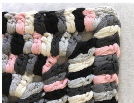
Et eksempel på et hjørne, der består af 2 stangmaskepar, 3 LM, 2 stangmaskepar i hullet fra de 3 LM fra forrige omgang

De to første omgange har jeg forsøgt at tegne i et diagram.