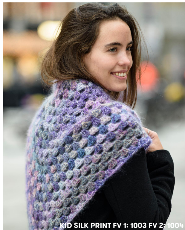
KID SILK PRINT FV 1: 1003 FV 2: 1004

Fortsæt til der ikke længere er garn nok til en hel række, klip tråden og hæft løse ender.