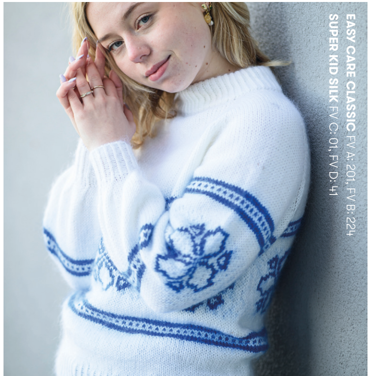
EASY CARE CLASSIC FV.A: 201, FV.B: 224 SUPER KID SILK FV.C: 01, FV.D: 41