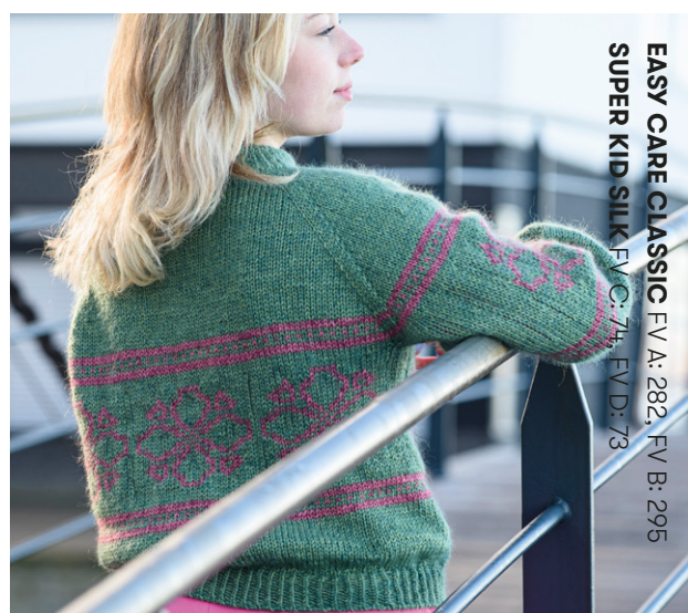
EASY CARE CLASSIC FV A: 282, FV B: 295 SUPER KID SILK FV C: 74, FV D: 73