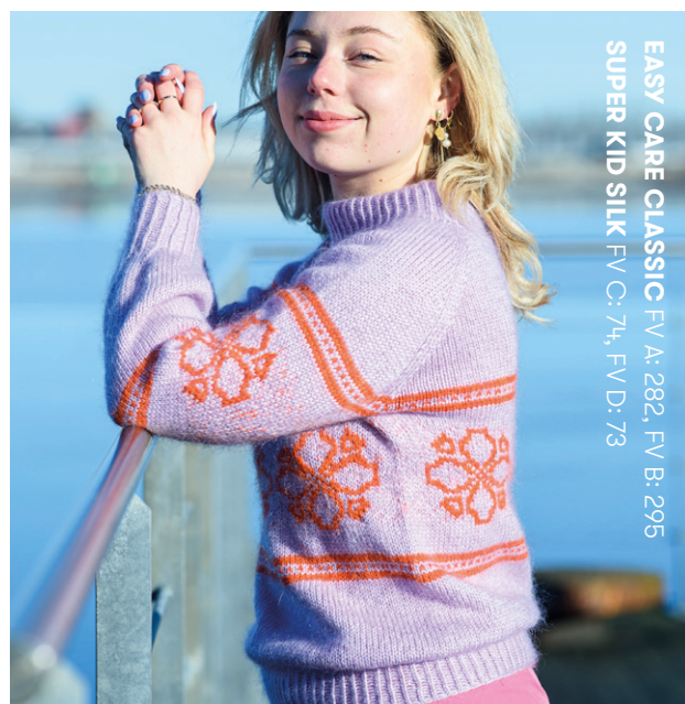
EASY CARE CLASSIC FV A: 282, FV B: 295 SUPER KID SILK FV C: 74, FV D: 73