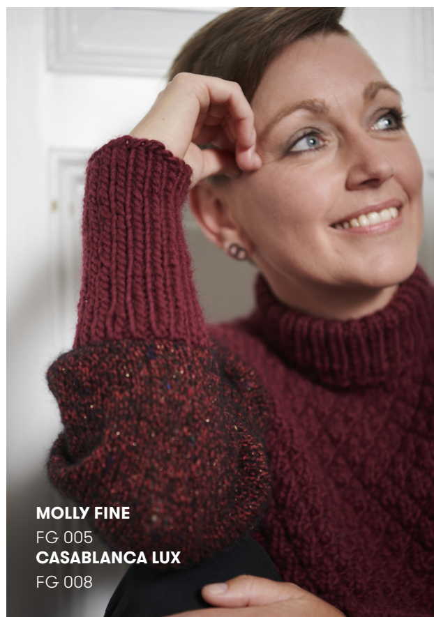
MOLLY FINE FG 005 CASABLANCA LUX FG 008

https://mymayflower.se - info@mayflower.dk