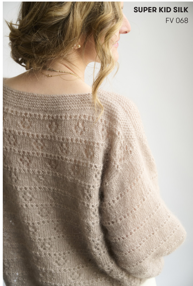
SUPER KID SILK FV 068