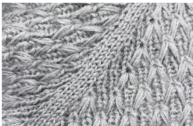
(Nærbillede af harlekinmønster med raglanudtagninger)