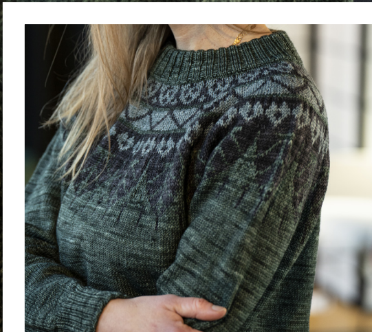
AMADORA FV 8, 9 OG 4