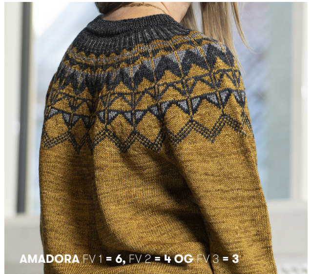
AMADORA FV 1 = 6, FV 2 = 4 OG FV 3 = 3