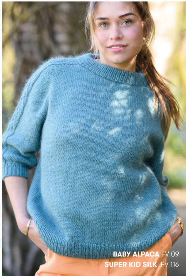
BABY ALPACA FV 09 SUPER KID SILK FV 116