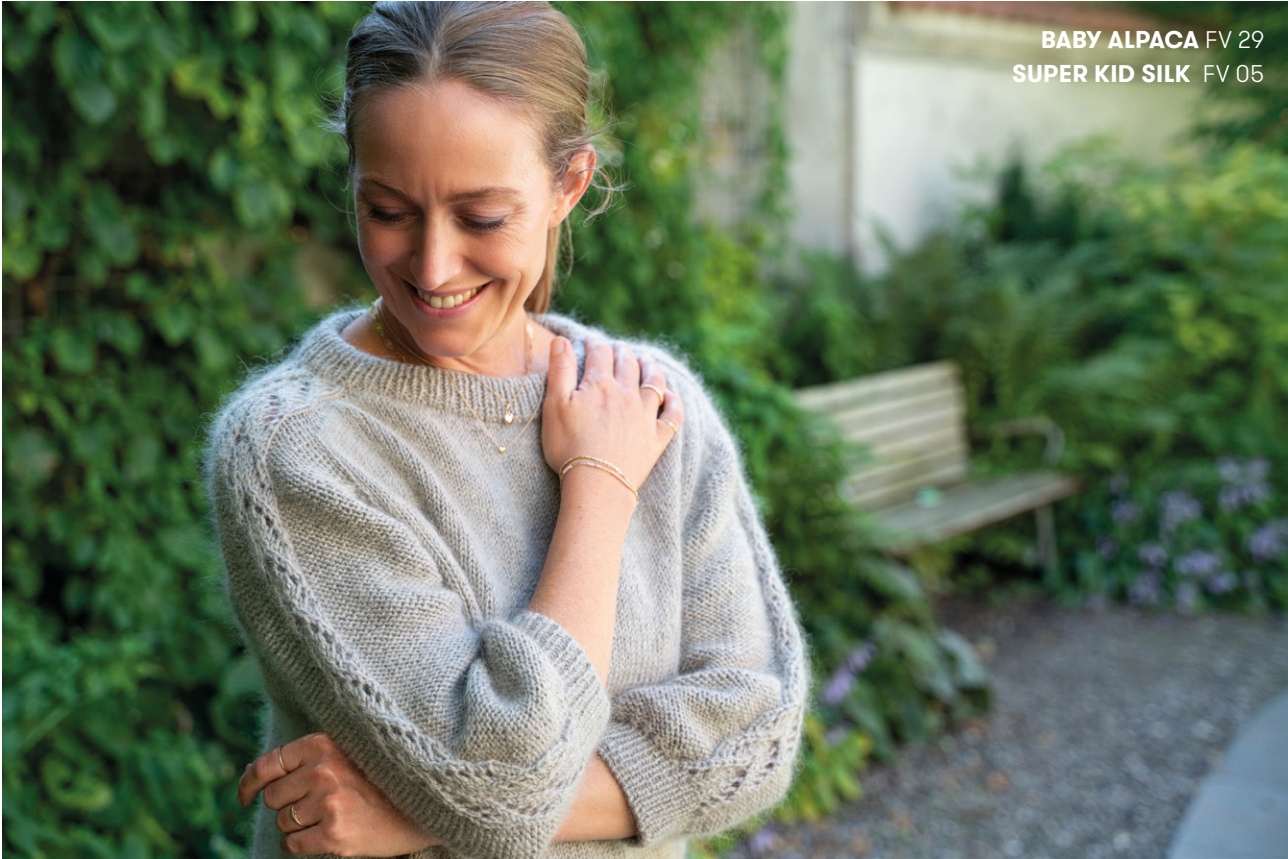
BABY ALPACA FV 29 SUPER KID SILK FV 05