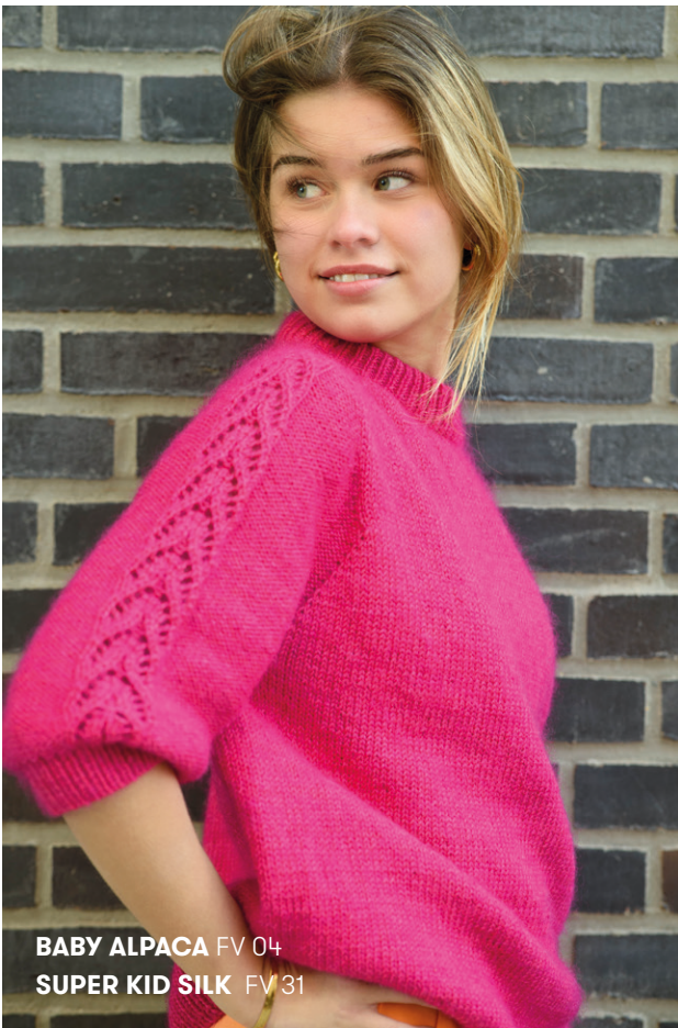
BABY ALPACA FV 04 SUPER KID SILK FV 31