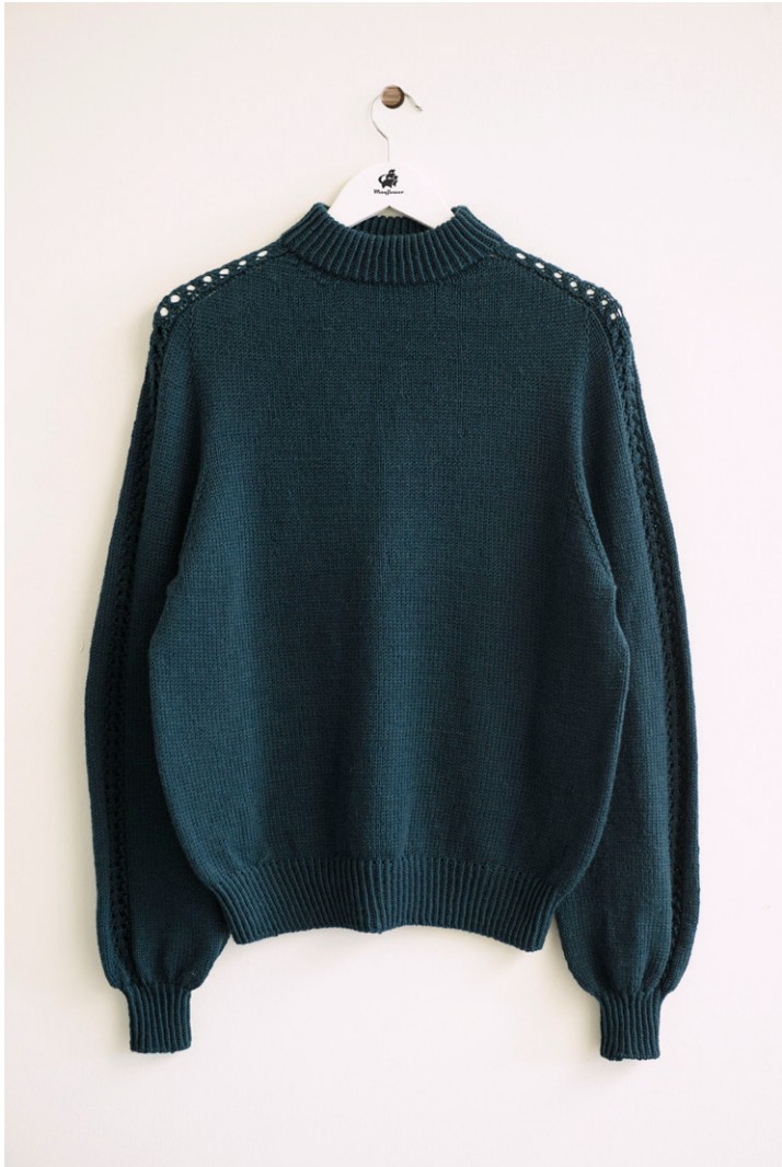
LONDON MERINO FV 24