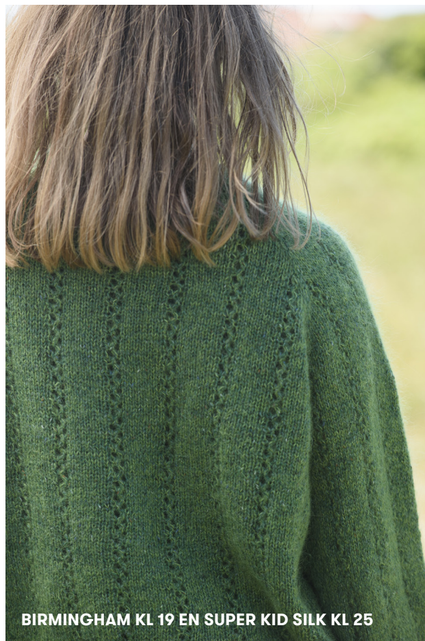
BIRMINGHAM KL 19 EN SUPER KID SILK KL 25