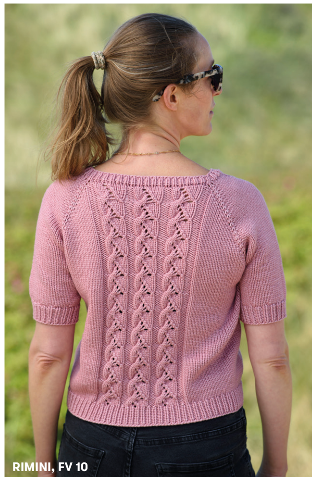
RIMINI, FV 10