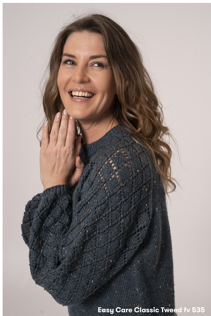
Easy Care Classic Tweed fv 535

Skift til p 3 og strik rib (1r, 1vr) i alt 2,5 cm. Luk af med italiensk aflukning.