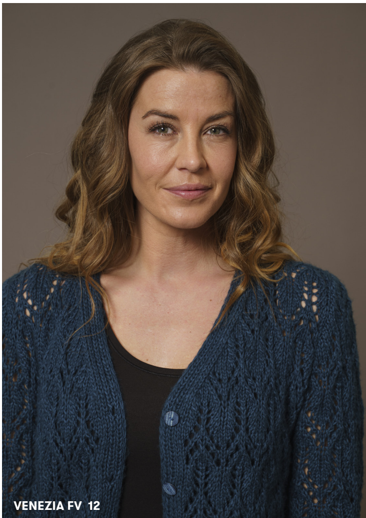
VENEZIA FV 12