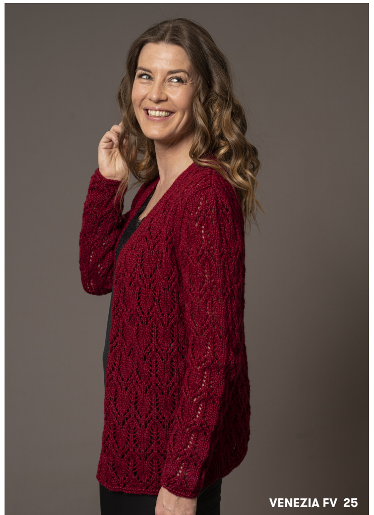
VENEZIA FV 25