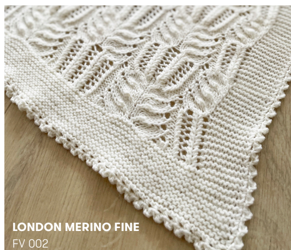
LONDON MERINO FINE FV 002

Spænd arb ud efter målene, fugt det let og lad det tørre.