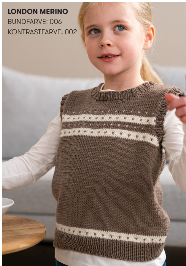
LONDON MERINO BUNDFARVE: 006 KONTRASTFARVE: 002