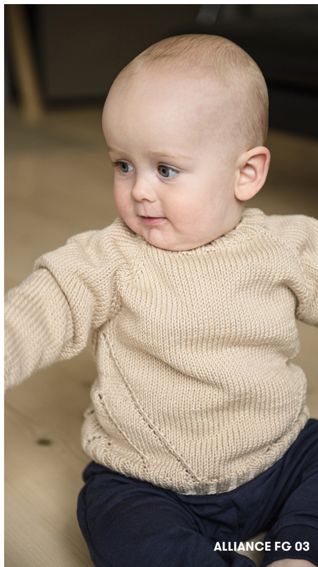
ALLIANCE FG 03

Strik så meget af diagrammet, som oplyst længde i opskrift. I de 2 små størrelser startes 3. hul-v ikke.