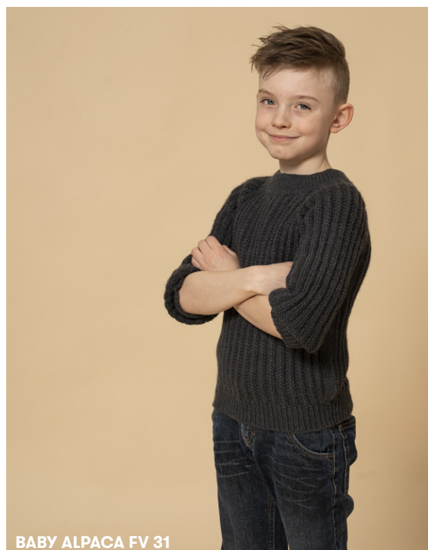
BABY ALPACA FV 31