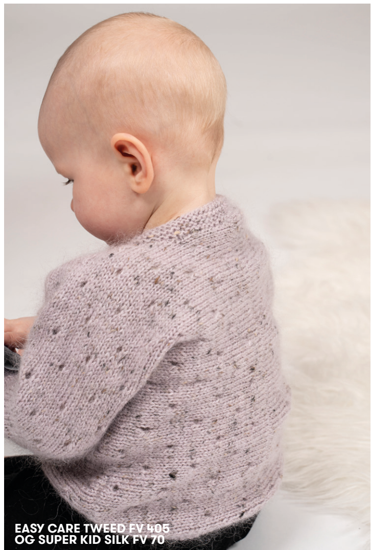
EASY CARE TWEED FV 405 OG SUPER KID SILK FV 70

\ = 1 m løs af, 1 r, træk den løse m over