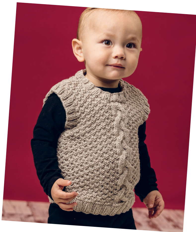
Vest med snoning

X = Vrang på retten og ret på vrangen. □ = Ret på retten og vrang på vrangen.