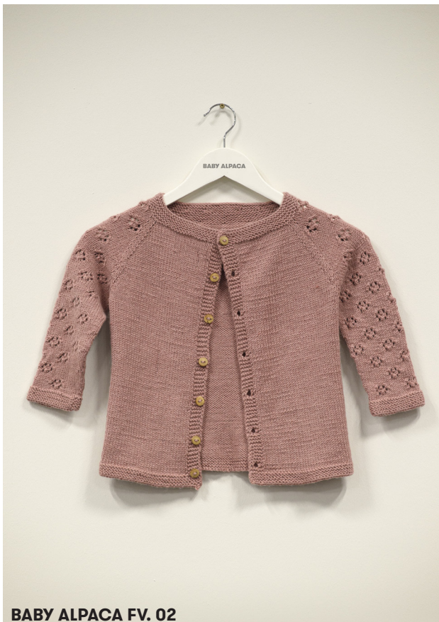
BABY ALPACA FV. 02

x = 1 m løs af, 2 r sm, træk den løse m over.