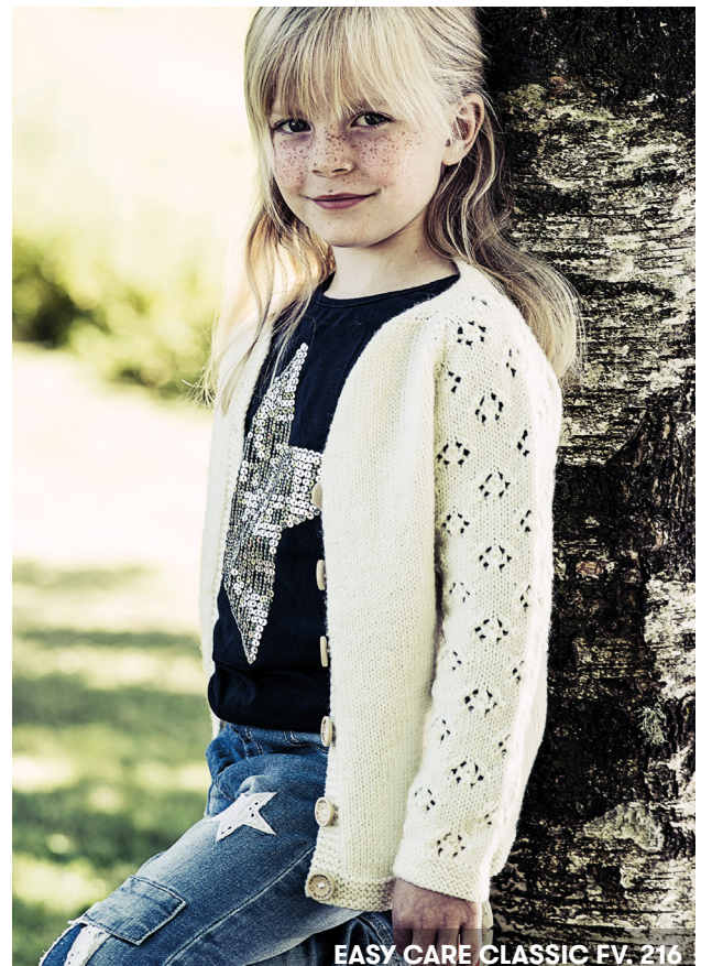
EASY CARE CLASSIC FV. 216