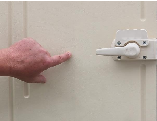
Innen-SAUBER für verschmutzte Kunststoff-Oberflächen, Böden und Schränke.

Für eine mühelose Reinigung und Pflege des Interieurs: Kunststoffe, lackierte und beschichtete Oberflächen, Alu, Leder, Alcantara, Stoff, Polster und mehr.