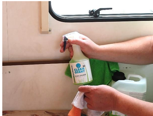
Für lackierte und beschichtete Oberflächen, Leder, Aluminium und vieles mehr.