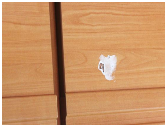
Zum Entfernen von Klebstoffresten, zum Lösen von Aufklebern, Folien und Etiketten.