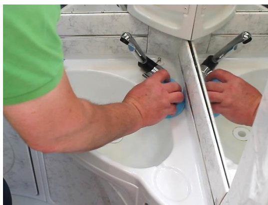
Für glatte, glänzende Kunststoff-Oberflächen, an denen Schmutz weniger haftet.