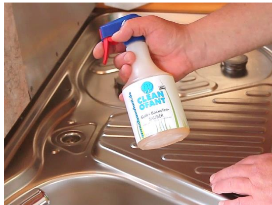
Grill+Backofen-SAUBER entfernt stärkste Verschmutzungen.