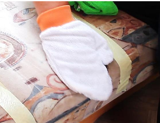
Polster-Teppich-SAUBER für Stoffe, Velours, Alcantara und viele weitere Textilien.