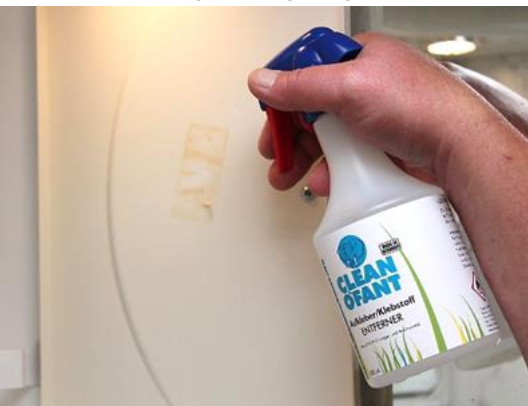
Aufkleber- & Klebstoff-ENTFERNER für außen & innen. Greift keine Materialien an.