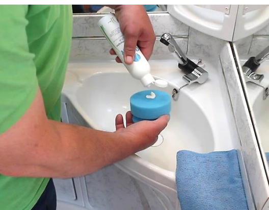
Acrylglas-Kunststoff-POLITUR zur Entfernung von hartnäckigen Ablagerungen.

Für alle Herausforderungen im Innenraum eine Lösung: Zur Aufbereitung von Oberflächen, zur Entfernung hartnäckiger Rückstände, zur schonenden Reinigung.