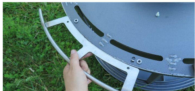
Schritt 4: Haltestange darauf legen

Legen Sie die Haltestange auf die Unterlagsscheiben.