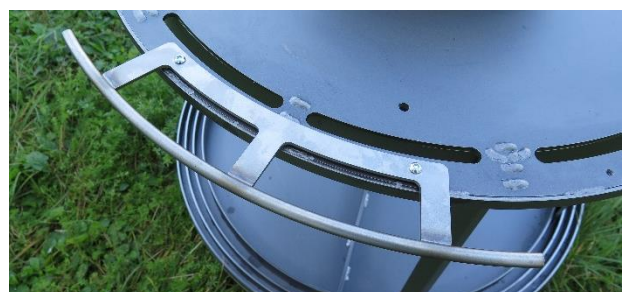
Schritt 5: Haltestange mit Schrauben

Befestigen Sie die Haltestange mit beiden Schrauben.