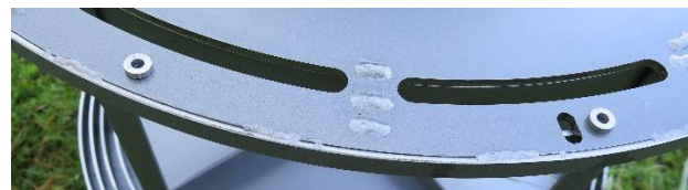
Schritt 3: Unterlagsscheiben

Legen Sie am gewünschten Ort die Unterlagsscheiben auf die Surprise