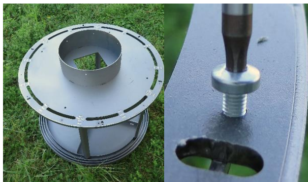
Schritt 1: Vorbereiten

Testen Sie, ob Sie die Schrauben ohne grossen Widerstand eindrehen können.