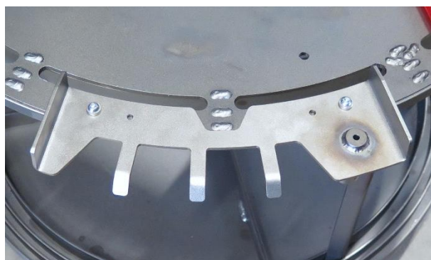
Schritt 4: beide Schrauben befestigt

Nun ist Ihr Zubehör montiert und Sie können die Surprise komplett zusammenbauen.