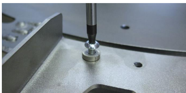
Schritt 3: erste Schraube

Suchen Sie sich die gewünschte Position aus. Legen Sie den Adapter auf die Surprise. Legen Sie die Unterlagsscheibe darauf und drehen Sie eine Schraube durch beide Teile etwas rein, aber ziehen Sie noch nicht an.