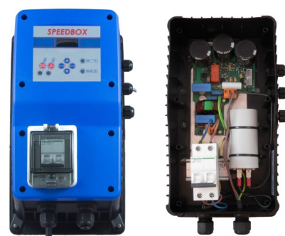
VERSIONE SUB MM